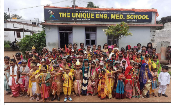
ಲಕ್ಷ್ಮೇಶ್ವರದ ದಿ ಯೂನಿಕ್ ಆಂಗ್ಲ ಮಾಧ್ಯಮ ಪೂರ್ವ ಪ್ರಾಥಮಿಕ ಶಾಲೆಯಲ್ಲಿ ಸೋಮವಾರ ಶ್ರೀ ಕೃಷ್ಣ ಜನ್ಮಾಷ್ಟಮಿ ನಿಮಿತ್ತ ಮಕ್ಕಳು ಕೃಷ್ಣ-ರೂಕ್ಮೀಯರ ವೇಷ ಧರಿಸಿ ಸಂಭ್ರಮಿಸಿ ಕಣ್ಮನ ಸೆಳೆದರು.