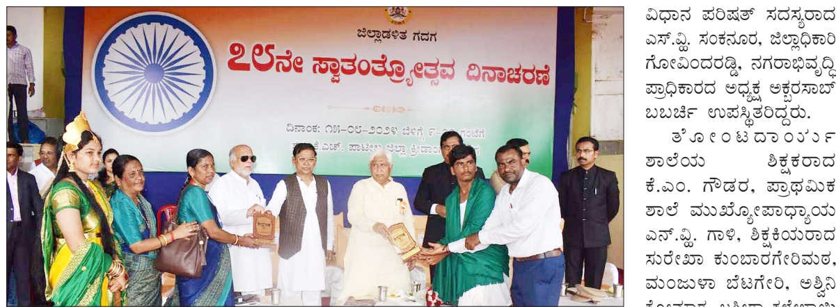
21ನೇ ಸ್ವಾತಂತ್ರ್ಯೋತ್ಸವ ದಿನಾಚರಣೆ