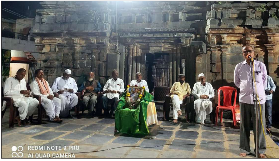
REDMI NOTE 9 PRO AI QUAD-CAMERA