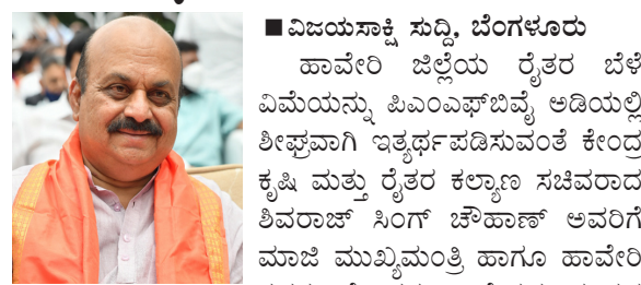
■ ವಿಜಯಸಾಕ್ಷಿ ಸುದ್ದಿ, ಬೆಂಗಳೂರು

ಹಾವೇರಿ ಜಿಲ್ಲೆಯ ರೈತರ ಬೆಳೆ ವಿಮೆಯನ್ನು ಪಿಎಂಎಫ್‌ಬಿವೈ ಅಡಿಯಲ್ಲಿ ಶೀಘ್ರವಾಗಿ ಇತ್ಯರ್ಥಪಡಿಸುವಂತೆ ಕೇಂದ್ರ ಕೃಷಿ ಮತ್ತು ರೈತರ ಕಲ್ಯಾಣ ಸಚಿವರಾದ ಶಿವರಾಜ್ ಸಿಂಗ್ ಚೌಹಾಣ್ ಅವರಿಗೆ ಮಾಜಿ ಮುಖ್ಯಮಂತ್ರಿ ಹಾಗೂ ಹಾವೇರಿ ಗದಗ ಲೋಕಸಭಾ ಕ್ಷೇತ್ರದ ಸಂಸದ ಬಸವರಾಜ ಬೊಮ್ಮಾಯಿಯವರು ವಿನಂತಿಸಿದ್ದಾರೆ.