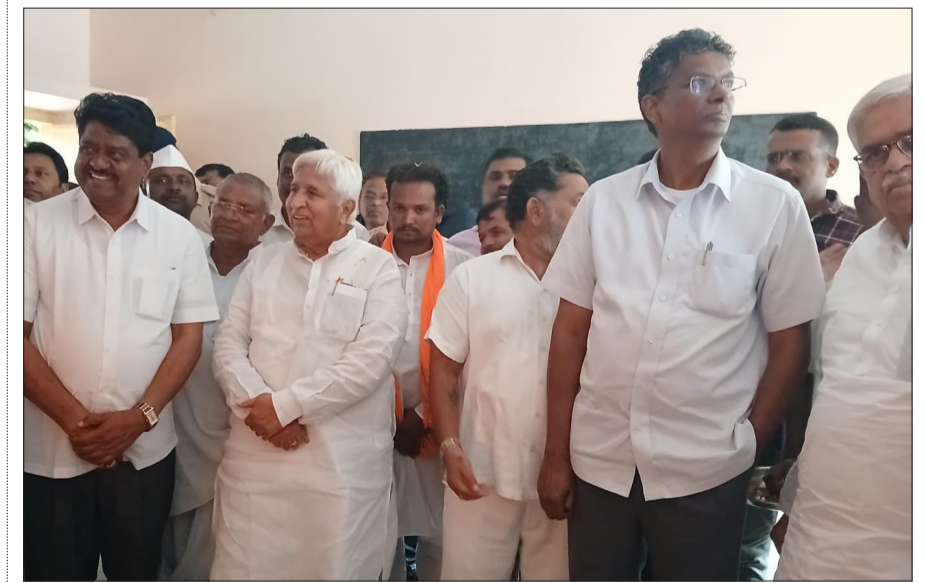
■ ವಿಜಯಸಾಕ್ಷಿ ಸುದ್ದಿ, ಗದಗ ಸೊರಟೂರ ಗ್ರಾಮದಲ್ಲಿ ಬುಧವಾರ ಜಿಲ್ಲಾಡಳಿತ, ಜಿಲ್ಲಾ ಪಂಚಾಯತ್, ತಾಲೂಕು ಶಿಕ್ಷಣ ಇಲಾಖೆ, ಲೋಕೋಪಯೋಗಿ ಇಲಾಖೆ ಸಹಯೋಗದಲ್ಲಿ ವಿವೇಕ ಯೋಜನೆಯಡಿ ಸರಕಾರಿ ಹಿರಿಯ ಪ್ರಾಥಮಿಕ ಕನ್ನಡ ಹೆಣ್ಣು ಮಕ್ಕಳ ಶಾಲೆಯ ನೂತನ ಕೊಠಡಿ ಇಂದು ರಾಜ್ಯದ ಕಾನೂನು, ನ್ಯಾಯ, ಮಾನವ