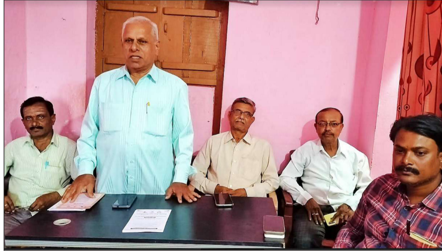
■ ವಿಜಯಸಾಕ್ಷಿ ಸುದ್ದಿ, ನರೇಗಲ್