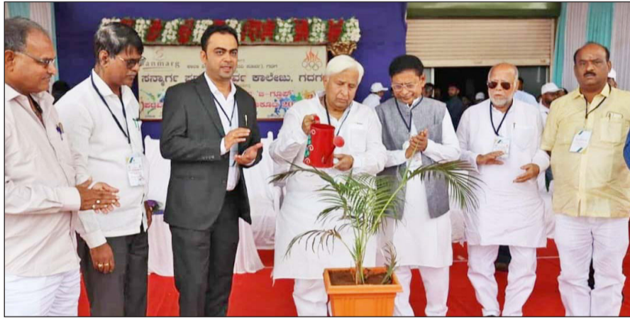
ವಿಜಯಿಗಳಾಗಲಿ ಎಂದರು. ಜಿಲ್ಲೆಯಲ್ಲಿರುವ ಈಜುಕೊಳಗಳು ಕಳೆದ ಬೇಸಿಗೆಯಲ್ಲಿ ಮಕ್ಕಳು ಸೇರಿದಂತೆ ಎಲ್ಲರ ಬೆಸಿಗೆ ಜಳವನ್ನು ತಣಿಸಿವೆ. ಇವುಗಳಿಂದ 70 ಸಾವಿರ ರೂ ಮೊತ್ತ ಸಂಗ್ರಹವಾಗಿದೆ. ಮೂಲಭೂತ ಸೌಕರ್ಯಗಳನ್ನು ನಾವು ನೀಡಲು ಬದ್ಧರಾಗಿದ್ದು, ಅವುಗಳ ಸದೃಶಕೆಯ ಜವಾಬ್ದಾರಿ ನಿಮ್ಮದು ಎಂದು ಹೇಳಿದರು.

■ ವಿಜಯಸಾಕ್ಷಿ ಸುದ್ದಿ, ಗದಗ ಗದಗ ಜಿಲ್ಲೆಯಲ್ಲಿ ಕ್ರೀಡಾಭ್ಯಾಸ ಮಾಡಲು ಎಲ್ಲ ರೀತಿಯ ಸೌಲಭ್ಯಗಳನ್ನು ಸರ್ಕಾರ ಒದಗಿಸಿದೆ. ಅವುಗಳನ್ನು ಸದೃಶಕೆ ಮಾಡಿಕೊಂಡು ಕ್ರೀಡಾ ಸಾಧನೆ ಮಾಡಬೇಕು ಎಂದು ರಾಜ್ಯದ ಕಾನೂನು, ನ್ಯಾಯ ಮತ್ತು ಮಾನವ ಹಕ್ಕುಗಳು, ಸಂಸದೀಯ ವ್ಯವಹಾರಗಳು, ಶಾಸನ ರಚನೆ ಮತ್ತು ಪ್ರವಾಸೋದ್ಯಮ ಇಲಾಖೆ ಹಾಗೂ ಗದಗ ಜಿಲ್ಲಾ ಉಸ್ತುವಾರಿ ಸಚಿವ ಡಾ. ಎಚ್.ಕೆ. ಪಾಟೀಲ ಹೇಳಿದರು. ನಗರದ ಕೆ.ಎಚ್. ಪಾಟೀಲ್ ಜಿಲ್ಲಾ ಕ್ರೀಡಾಂಗಣದಲ್ಲಿ ಬುಧವಾರ ಹಮ್ಮಿಕೊಂಡಿದ್ದ ಗದಗ ತಾಲೂಕು ಮಟ್ಟದ 'ಬಿ' ಗ್ರೂಪ್ ಪದವಿಪೂರ್ವ ಕಾಲೇಜುಗಳ ಅಥ್ಲೆಟಿಕ್ ಕ್ರೀಡಾಕೂಟಕ್ಕೆ ಚಾಲನೆ ನೀಡಿ ಮಾತನಾಡಿದರು. ಒಲಿಂಪಿಕ್‌ನಲ್ಲಿ ಈಗಾಗಲೇ ದೇಶದ ಕ್ರೀಡಾಪಟುಗಳು ಉತ್ತಮ ಪ್ರದರ್ಶನ ತೋರಿ ಸಾಧನೆಗೈಯುತ್ತಿದ್ದಾರೆ. ಮನು ಬಾಕರ್, ಸರ್ವೋಜಿತ ಸಿಂಗ್, ಸ್ಪಿನಿತ್ ಕುಸಲ್ ಅವರುಗಳು ಶೂಟಿಂಗ್‌ನಲ್ಲಿ ಪ್ರಾಂಜ್ ಮೆಡಲ್ ಪಡೆದಿದ್ದಾರೆ. ನೀರಜ್ ಚೋಪ್ರಾ ಅವರು ಫೈನಲ್ ತಲುಪಿದ್ದು ಅವರು ವಿಜಯಶಾಲಿಯಾಗಲಿ ಎಂದು ಶುಭಾಶೀರ್ವಚನ ನೀಡಿ, ಕುಸ್ತಿಯಲ್ಲಿ ನಿತೇಶ್ ಪೋಗಾಡ್, ಹಾಕಿ ತಂಡವು ಮೂರನೇ ಸ್ಥಾನಕ್ಕೆ ಸೇರಿಸಬೇಕೆಂದು ಇವರಲ್ಲಿರೂ