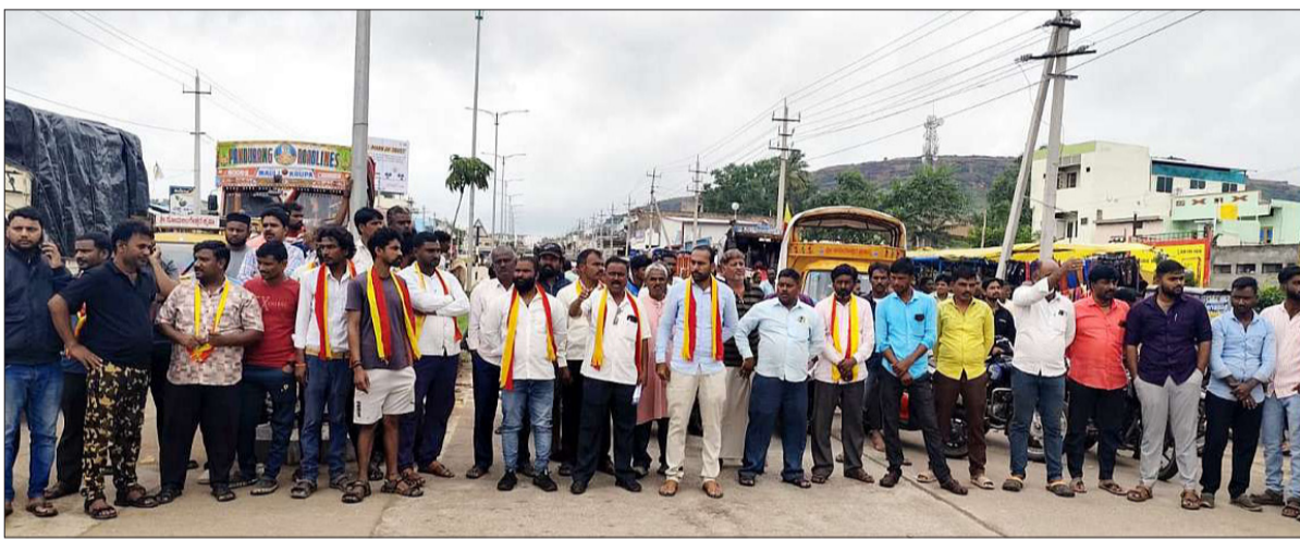
■ ವಿಜಯಸಾಕ್ಷಿ ಸುದ್ದಿ, ಗಚೇಂದ್ರಗಡ

ಪಟ್ಟಣದ ಚನ್ನಮ್ಮ ವೃತ್ತದ ಪುರ್ತುಗೇರಿ ಕ್ರಾಸ್‌ವರೆಗಿನ ರಾಷ್ಟ್ರೀಯ ಹೆದ್ದಾರಿ-637ರ ಈದ್ದಾ ಮೈದಾನ ಸೇರಿ ಅಗತ್ಯ ಸ್ಥಳಗಳಲ್ಲಿ ರೋಡ್ ಬ್ಲಾಕ್‌ಗಳನ್ನು ನಿರ್ಮಿಸಬೇಕು ಎಂದು ಅಗ್ರಹಿಸಿ ಬುಧವಾರ ನಮ್ಮ ಕರ್ನಾಟಕ ಸೇನೆ ಕಾರ್ಯಕರ್ತರು ಹಾಗೂ ಸಾರ್ವಜನಿಕರು ಪ್ರತಿಭಟನೆ ನಡೆಸಿದರು.