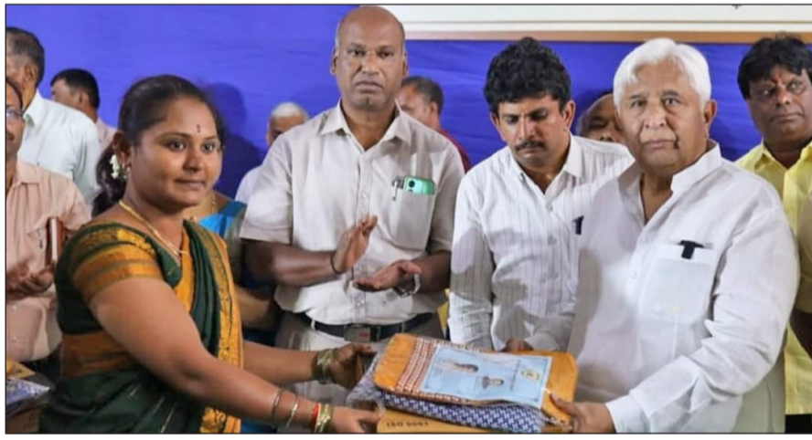
ಹಾಗೂ ಕಾರ್ಯಕರ್ತೆಗೆ ಸರ್ಕಾರದಿಂದ ಉಚಿತವಾಗಿ ಮೊಬೈಲ್ ಹಾಗೂ ಸಮವಸ್ತ್ರ ವಿತರಣೆ ಮಾಡಲಾಗುತ್ತಿದೆ ಎಂದರು.

■ ವಿಜಯಸಾಕ್ಷಿ ಸುದ್ದಿ, ಗದಗ ಸರ್ಕಾರದ ಮಹಾತ್ಮಾಕಾಂಕ್ಷಿ ಯೋಜನೆಗಳನ್ನು ಅನುಷ್ಠಾನಗೊಳಿಸಿ, ಯಶಸ್ವಿಯಾಗಿಸುವಲ್ಲಿ ಅಂಗನವಾಡಿ ಕಾರ್ಯಕರ್ತೆಯರ ಪಾತ್ರ ಅಪಾರವಾಗಿದೆ ಎಂದು ಜಿಲ್ಲಾ ಉಸ್ತುವಾರಿ ಸಚಿವ ಡಾ. ಎಚ್.ಕೆ. ಪಾಟೀಲ ಹೇಳಿದರು. ನಗರದ ಕೆ.ಎಚ್. ಪಾಟೀಲ ಸಭಾಂಗಣದಲ್ಲಿ ಬುಧವಾರ ಏರ್ಪಡಿಸಲಾಗಿದ್ದ ಗದಗ ತಾಲೂಕಿನ ಅಂಗನವಾಡಿ ಕಾರ್ಯಕರ್ತೆ ಮತ್ತು ಅಂಗನವಾಡಿ ಸಹಾಯಕಿಯರಿಗೆ ಮೊಬೈಲ್ ಮತ್ತು ಸಮವಸ್ತ್ರ ವಿತರಣೆ ಕಾರ್ಯಕ್ರಮ ಉದ್ಘಾಟಿಸಿ ಅವರು ಮಾತನಾಡಿದರು. ಸರ್ಕಾರದ ಯೋಜನೆಗಳ ಸಮರ್ಪಕ ಅನುಷ್ಠಾನ ಹಾಗೂ ಮಾಹಿತಿ ಸಂಗ್ರಹಿಸುವಲ್ಲಿ ಅಂಗನವಾಡಿ ಕಾರ್ಯಕರ್ತೆಯರು ಅಪಾರ ಶ್ರಮ ವಹಿಸುತ್ತಾರೆ. ಅವರ ಸಂಪೂರ್ಣ ಸಹಭಾಗಿತ್ವದೊಂದಿಗೆ ಯೋಜನೆಗಳು ಅನುಷ್ಠಾನಗೊಂಡು ಯಶಸ್ವಿಯಾಗುತ್ತವೆ. ಈ ಹಿನ್ನೆಲೆಯಲ್ಲಿ ಅಂಗನವಾಡಿ ಸಹಾಯಕರು