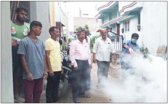
■ ವಿಜಯಸಾಕ್ಷಿ ಸುದ್ದಿ, ಗದಗ

ಮಾರಕ ಡೆಂಗ್ಯೂ ಕಾಯಿಲೆ ಹರಡದಂತೆ ತಡೆಯಲು ಮುಂಜಾಗತೆಗಾಗಿ ಜಿಲ್ಲಾ ಆರೋಗ್ಯ ಇಲಾಖೆ ಮತ್ತು ಗದಗ-ಬೆಟಗೇರಿ ನಗರಸಭೆಯ ಸಂಯುಕ್ತ ಆಶ್ರಯದಲ್ಲಿ ಇಲ್ಲಿನ 23 ವಾರ್ಡ್‌ನ ಬಕ್ಕಲಗೇರಿಯ 3ನೇ ಬ್ಲಾಕ್‌ನಲ್ಲಿ ಫಾಗಿಂಗ್ ಮಾಡಲಾಯಿತು.