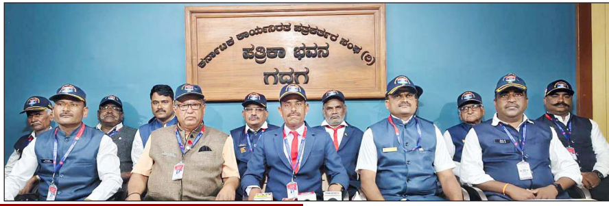
ಸಾಮಾಜಿಕ ಕಾರ್ಯಕ್ರಮಕ್ಕೂ ಸೈ