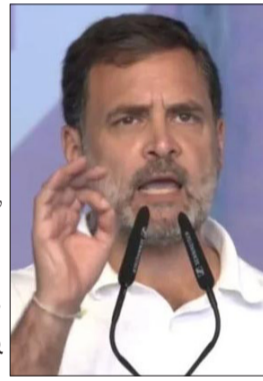
ಧನ್ಯವಾದಗಳು ಮತ್ತು ನೀಟ್ ವಿಷಯವು ದಿನದ ಪ್ರಮುಖ ವಿಷಯವಾಗಿದೆ. ವಿರೋಧ ಪಕ್ಷಗಳು ಎಲ್ಲಕ್ಕಿಂತ ಮೊದಲು ಅದನ್ನು ಚರ್ಚೆಗೆ ತೆಗೆದುಕೊಳ್ಳಬೇಕೆಂದು ಒತ್ತಾಯಿಸಿದೆ” ಎಂದು ರಾಹುಲ್ ಗಾಂಧಿ ಹೇಳಿದರು.

■ ವಿಜಯಸಾಕ್ಷಿ ಸುದ್ದಿ, ನವದೆಹಲಿ ನೀಟ್ ಪರೀಕ್ಷೆಯಲ್ಲಿ ನಡೆದಿದ್ದ ಎನ್ನಲಾದ ಅವ್ಯವಹಾರಗಳ ಕುರಿತು ಸಂಸತ್ತಿನಲ್ಲಿ ಗೌರವಯುತ ಹಾಗೂ ಉತ್ತಮ ಚರ್ಚೆ ನಡೆಸುವಂತೆ ಪ್ರಧಾನಿ ನರೇಂದ್ರ ಮೋದಿ ಅವರನ್ನು ಒತ್ತಾಯಿಸಿದ ಲೋಕಸಭೆಯ ವಿರೋಧ ಪಕ್ಷದ ನಾಯಕ ರಾಹುಲ್ ಗಾಂಧಿ. “ಈ ಬಗ್ಗೆ ಪ್ರಸ್ತಾವನೆಗೂ ಮುನ್ನ ಚರ್ಚಿಸಬೇಕು” ಎಂದು ಹೇಳಿದರು. “ಅಧ್ಯಕ್ಷರ ಭಾಷಣಕ್ಕೆ ಧನ್ಯವಾದಗಳು ಮತ್ತು ನೀಟ್ ವಿಷಯವು ದಿನದ ಪ್ರಮುಖ ವಿಷಯವಾಗಿದೆ. ವಿರೋಧ ಪಕ್ಷಗಳು ಎಲ್ಲಕ್ಕಿಂತ ಮೊದಲು ಅದನ್ನು ಚರ್ಚೆಗೆ ತೆಗೆದುಕೊಳ್ಳಬೇಕೆಂದು ಒತ್ತಾಯಿಸಿದೆ” ಎಂದು ರಾಹುಲ್ ಗಾಂಧಿ ಹೇಳಿದರು.