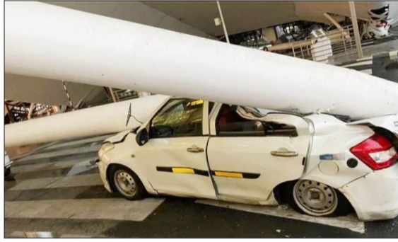
■ ವಿಜಯಸಾಕ್ಷಿ ಸುದ್ದಿ, ನವದೆಹಲಿ

ಭಾರೀ ಮಳೆಯಿಂದಾಗಿ ದೆಹಲಿ ವಿಮಾನ ನಿಲ್ದಾಣದ ಟರ್ಮಿನಲ್ -1 (ಟಿ 1) ನ ಭಾವಣಿಯ ಒಂದು ಭಾಗವು ಕಾರುಗಳ ಮೇಲೆ ಕುಸಿದಿದ್ದು, ಕನಿಷ್ಠ ಒಬ್ಬರು ಸಾವನ್ನಪ್ಪಿದರು ಮತ್ತು ಆರು ಮಂದಿ ಗಾಯಗೊಂಡಿದ್ದಾರೆ. ದೇಶೀಯ ವಿಮಾನ ಕಾರ್ಯಾಚರಣೆಗಳನ್ನು ಹೊಂದಿರುವ ಟರ್ಮಿನಲ್ 1 ರಿಂದ ಎಲ್ಲ ಸಂಚಾರವನ್ನು ತಾತ್ಕಾಲಿಕವಾಗಿ ಸ್ಥಗಿತಗೊಳಿಸಲಾಗಿದೆ ಎಂದು ನಾಗರಿಕ ವಿಮಾನಯಾನ ಸಚಿವಾಲಯ ತಿಳಿಸಿದೆ.