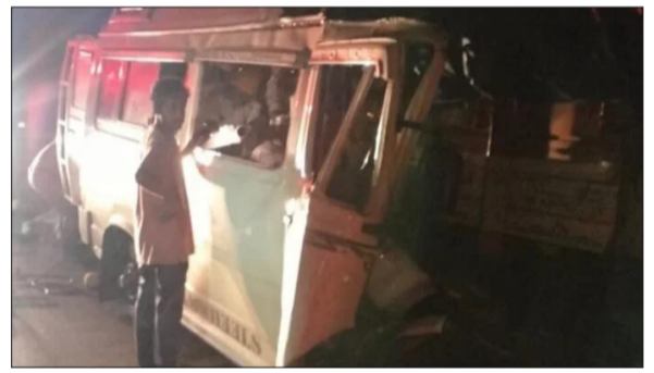
4 ಗಂಟೆಯ ಸುಮಾರಿಗೆ ಭದ್ರಾವತಿ ತಾಲೂಕಿನ ಹೊಳೆ ಹೊನ್ನೂರು ಬಳಿಯ ಎಮ್ಮಿಹಟ್ಟಿ ಮೃತರಲ್ಲೂ ಶಿವಮೊಗ್ಗ ಜಿಲ್ಲೆ ಗ್ರಾಮದವರು ಎಂದು ವರದಿಗಳು ಹೇಳಿವೆ.

4 ಗಂಟೆಯ ಸುಮಾರಿಗೆ ಭದ್ರಾವತಿ ತಾಲೂಕಿನ ಹೊಳೆ ಹೊನ್ನೂರು ಬಳಿಯ ಎಮ್ಮಿಹಟ್ಟಿ ಮೃತರಲ್ಲೂ ಶಿವಮೊಗ್ಗ ಜಿಲ್ಲೆ ಗ್ರಾಮದವರು ಎಂದು ವರದಿಗಳು ಹೇಳಿವೆ. ಅಪಘಾತದಲ್ಲಿ ನಾಲ್ವರು ಗಾಯಗೊಂಡಿದ್ದು, ಅವರನ್ನು ಆಸ್ಪತ್ರೆಗೆ ದಾಖಲಿಸಲಾಗಿದೆ ಎಂದು ತಿಳಿದು ಬಂದಿದೆ. ಘಟನಾ ಸ್ಥಳಕ್ಕೆ ದೌಡಾಯಿಸಿದ ಅಗ್ನಿಶಾಮಕ ದಳದ ಸಿಬ್ಬಂದಿ ಅಪಘಾತಕ್ಕೀಡಾದ ವಾಹನದಲ್ಲಿದ್ದ ಮೃತ ದೇಹಗಳನ್ನು ಹೊರ ತೆಗೆದಿದ್ದಾರೆ. ಬ್ಯಾಡಗಿ ಪೊಲೀಸರು ಸ್ಥಳಕ್ಕೆ ಭೇಟಿ ನೀಡಿ ಪರಿಶೀಲನೆ ನಡೆಸಿದ್ದಾರೆ.