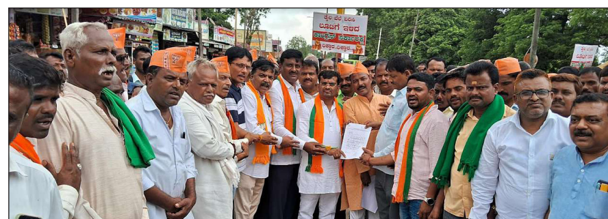
ಈಗಾಗಲೇ ಜನಸಾಮಾನ್ಯರು ಉಪಯೋಗಿಸುವ ಹಾಲು, ಮಿಡ್ಲೆಟ್, ಸ್ಟಾಂಪ್ ಡ್ಯೂಟಿ, ವಾಹನ ನೋಂದಣಿ ಸೇರಿದಂತೆ ರೈತರು ಉಪಯೋಗಿಸುವ ಬಿತ್ತನೆ ಬೀಜ, ಪಹಣಿ ಪತ್ರ, ಆಸ್ತಿಗಳ ನೋಂದಣಿ ಶುಲ್ಕ, ಇಂಜಿನಿಯರಿಂಗ್ ಪ್ರವೇಶ ಶುಲ್ಕ, ವಾಹನಗಳ ಮೇಲೆ ತೆರಿಗೆ ಸೇರಿದಂತೆ ಹತ್ತಾರು ಬೆಲೆ ಏರಿಕೆ ಜೊತೆಗೆ ಹೆಚ್ಚೋಲ್ ಡೀಸೆಲ್ ದರ ಏರಿಕೆ ಮಾಡಿರುವುದು ಸರ್ಕಾರ ದಿವಾಳಿಯಾಗಿದೆ ಎಂದು ನಿರೂಪಿಸುತ್ತಿದೆ. ಸರ್ಕಾರ ಕೂಡಲೇ ಬೆಲೆ ಏರಿಕೆ ನಿರ್ಧಾರ ಕೈಬಿಡಬೇಕು. ಇಲ್ಲವಾದರೆ ಬಿಜೆಪಿ ಕಾರ್ಯಕರ್ತರು ಹಳ್ಳಿ ಹಳ್ಳಿಗಳಲ್ಲಿ ಹೋರಾಟ ನಡೆಸಲಿದ್ದಾರೆ ಎಂದರು.