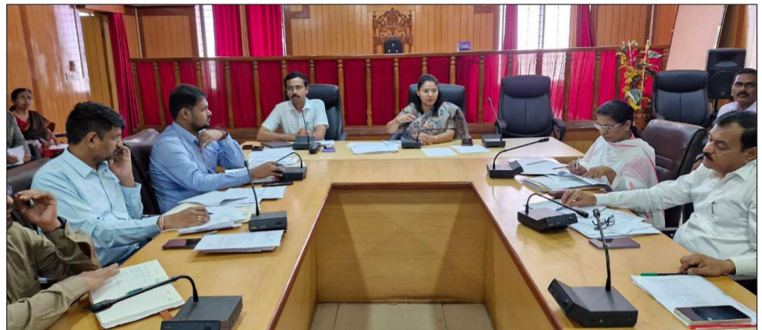
ಅನಿರೀಕ್ಷಿತ ಭೇಟಿ ನೀಡಲಿದ್ದಾರೆ ಎಂದರು. ಜಿಲ್ಲಾ ಹಂತದ ಎಲ್ಲ ಇಲಾಖೆ ಅಧಿಕಾರಿಗಳು ತಮ್ಮ ಇಲಾಖೆ