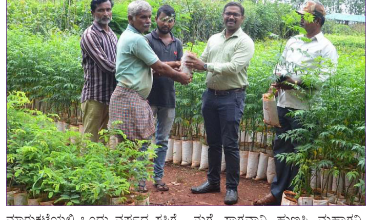
ಮಾರುಕಟ್ಟೆಯಲ್ಲಿ ಒಂದು ವರ್ಷದ ಸಸಿ 40 ರೂ.ಗಳಿದ್ದರೆ 6 ರೂ.ಗಳಲ್ಲಿ ಆ ಸಸಿಗಳನ್ನು ಬಂಕದಕಟ್ಟೆಯ ಪೈಟೆಕ್ ನರ್ಸಿಂಗ್ ಕೇಂದ್ರ ವಿತರಿಸುವ ಮೂಲಕ ಸಸಿಗಳನ್ನು ನೆಡಲು ಪ್ರೇರಣೆ ನೀಡಲಿದೆ. ಬಂಕದಕಟ್ಟೆ ಪೈಟೆಕ್ ನರ್ಸಿಂಗ್ ಕೇಂದ್ರದಲ್ಲಿ ನುಗ್ಗೆ, ಸಾಗವಾನಿ, ಹುಣಸಿ, ಹುಕ್ಕಾಣಿ, ನೆಲ್ಲಿ, ಬಿದಿರು, ಬೇವು ಸೇರಿದಂತೆ ವಿವಿಧ ತಳಿಯ ಸಸಿಗಳು ಲಭ್ಯವಿವೆ. ಬಿಸಿಲಿನ ಬೆಳೆಗೆ ತಡೆಯಲು ತಂಪಾದ ವಾತಾವರಣ ನಿರ್ಮಿಸಿ ಮಳೆಗೆ ಅನುವು ಮಾಡಿಕೊಡುವ ಪರಿಸರ ಸೃಷ್ಟಿಸಿ ಸಸಿಗಳ