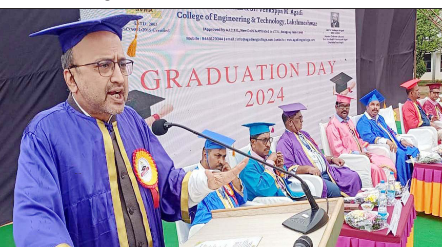
GRADUATION DAY 2024

ಸಾಧಿಸುವ ಇಚ್ಛೆಯಿದ್ದರೆ ಏನನ್ನೂ ಸಾಧನೆ ಸಾಧ್ಯವಾಗುತ್ತದೆ. ಈ ನಿಟ್ಟಿನಲ್ಲಿ ಯುವ ಇಂಜಿನಿಯರುಗಳು ದೇಶದ ವಿವಿಧ ಕ್ಷೇತ್ರಗಳ ಮತ್ತು ಪ್ರಗತಿಗಾಗಿ ಹೊಸ ತಂತ್ರಜ್ಞಾನವನ್ನು ಕಂಡುಹಿಡಿದು ತಮ್ಮದೇ ಆದ ಶ್ರೇಷ್ಠ ಕೊಡುಗೆ ಸಲ್ಲಿಸಬೇಕು. ಮೊಬೈಲ್, ಕಂಪ್ಯೂಟರ್ ಬಳಕೆ ಅತಿಯಾಗುತ್ತಿದ್ದು, ಇಂಜಿನಿಯರಿಂಗ್ ವಿದ್ಯಾರ್ಥಿಗಳು ಇದರ ಸದ್ವಿನಿಯೋಗ ಮಾಡಿಕೊಳ್ಳಬೇಕು. ಯುವಕರು ದೇಶದ