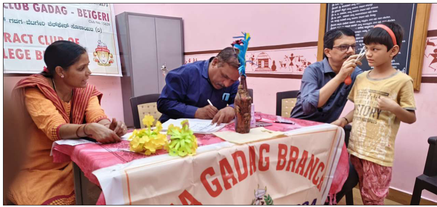
■ ವಿಜಯಸಾಕ್ಷಿ ಸುದ್ದಿ, ಗದಗ

ಭಾರತೀಯ ವೈದ್ಯಕೀಯ ಸಂಸ್ಥೆ ಗದಗ, ರೋಟಾರ್ಸ್ ಕ್ಲಬ್, ಜಿ.ಟಿ. ಕಾಲೇಜ್ ಬಿಸಿಎ ಮತ್ತು ಬಿಬಿಎ ಹಾಗೂ ರೋಟರಿ ಸಂಸ್ಥೆ ಗದಗ-ಬೆಂಗಳೂರು