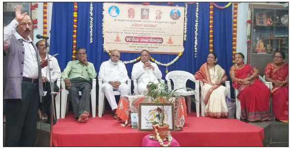
■ ವಿಜಯಸಾಕ್ಷಿ ಸುದ್ದಿ, ಗದಗ