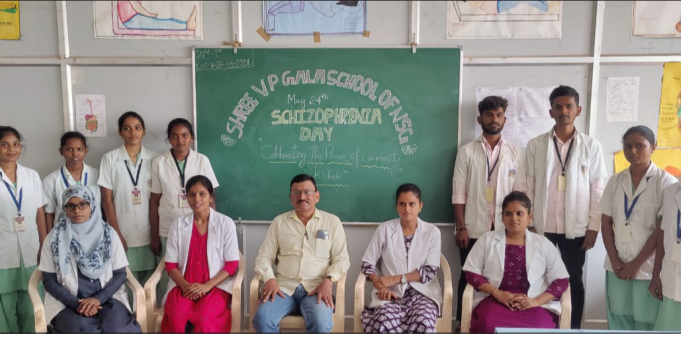
ನಗರದ ವಿ.ಓ. ಸ್ಕೂಲ್ ಆಫ್ ನರ್ಸಿಂಗ್ ಹಾಗೂ ಇನ್ಸ್ಟಿಟ್ಯೂಟ್ ಆಫ್ ಪ್ಯಾರಾಮೆಡಿಕಲ್ ಸೈನ್ಸಸ್‌ನಲ್ಲಿ