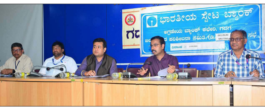
ಒದಗಿಸಬೇಕಾದ ಸೌಲಭ್ಯಗಳನ್ನು ವಿಳಂಬ ಮಾಡದೇ ಸೂಚಿಸಿದರು. ಲೀಡ್ ಬ್ಯಾಂಕಿನ ಮ್ಯಾನೇಜರ್ ಸಮಯಕ್ಕೆ ಸರಿಯಾಗಿ ನೀಡಬೇಕು ಎಂದು ಜಿಲ್ಲಾ, ಎಸಿಪಿ ಮತ್ತು ಆದ್ಯತಾ ವಲಯದ ಸಾಲದ