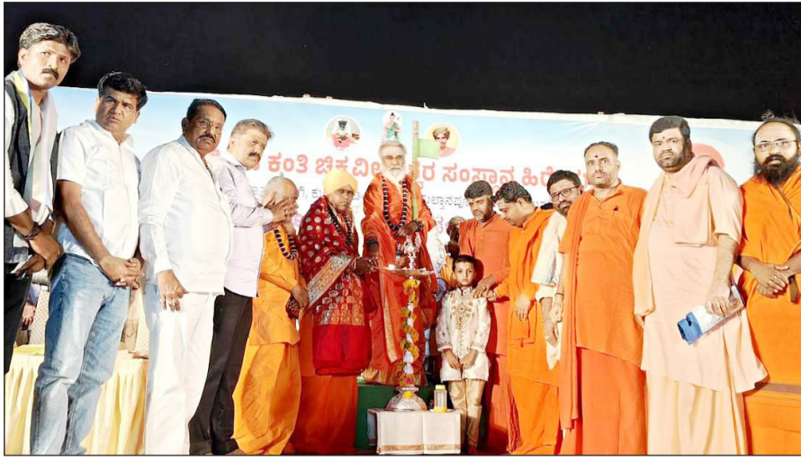
ಗುರು ಶಿಷ್ಯರ ಸಂಬಂಧ ಚಿರಂತನ ಮತ್ತು ನಿತ್ಯ ನೂತನ.

ಸ್ವಾರ್ಥರಹಿತ ಬದುಕಿಗೆ ಬೆಲೆಯಿದೆ ಮತ್ತು ಬಲವಿದೆ. ಹಿರಿಯರ ಮೌಲ್ಯಧಾರಿತ ಚಿಂತನೆಗಳು ಬಾಳಿನ ಆಶಾಕಿರಣವಾಗಿವೆ. ಧರ್ಮ ಮತ್ತು ಧರ್ಮಾಚರಣೆ ಮರೆತರೆ ಅಪಾಯ ತಪ್ಪಿಲ್ಲ. ಶಸ್ತ್ರ ಪ್ರಭುತ್ವ ಮತ್ತು ಅರ್ಥಗಳು ಅಜ್ಞಾನಿಯ ಕೈಯಲ್ಲಿದ್ದರೆ ಸರ್ವನಾಶ. ಅದೇ ಸಜ್ಜನರ ಕೈಯಲ್ಲಿದ್ದರೆ ಜನಹಿತಾತ್ಮಕ ಕಾರ್ಯಗಳು ನಡೆಯುತ್ತವೆ. ಸಮಾಜದ ಓರೆ-ಕೋರೆಗಳನ್ನು ತಿದ್ದಿ ತೀಡಿ ಮುನ್ನಡೆಸುವುದೇ ಗುರುವಿನ ಧರ್ಮವಾಗಿದೆ. ಪ್ರಾಪಂಚಿಕ ಸಂಬಂಧಗಳು ಕೆಲವು ಸಂದರ್ಭಗಳಲ್ಲಿ ಕೆಡಬಹುದು. ಆದರೆ