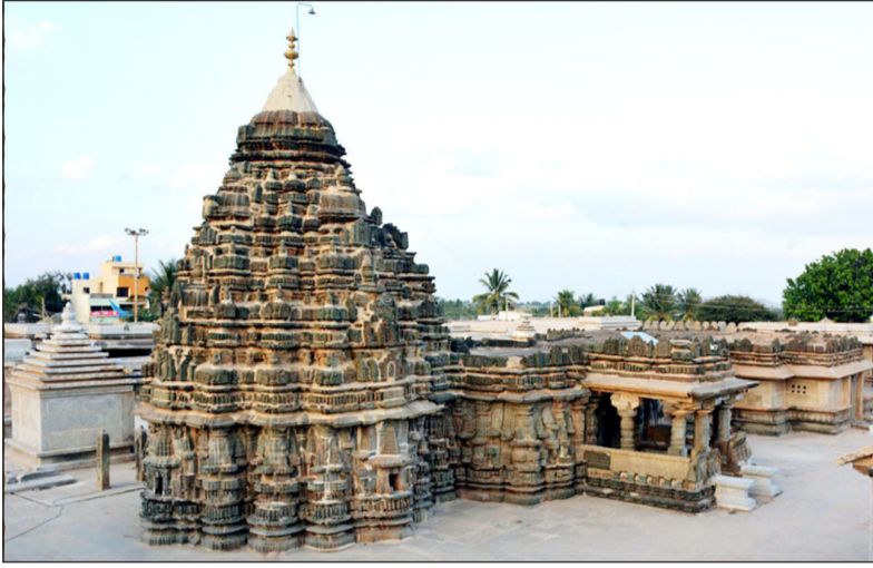
ನೂರ್ಯನ ಕಿರಣಗಳು ನೇರ ಮೂರ್ತಿಗೆ

ಪ್ರತಿವರ್ಷ ಮೇ ತಿಂಗಳ ಮಾಘಶುದ್ಧ ಬಹುಳ ನಕ್ಷತ್ರದಂದು ಅಂದರೆ ಸರಿಸುಮಾರು ಮೇ 25ರಿಂದ 30ರ ಅವಧಿಯಲ್ಲಿ ಸುಯೋಧದಿಂದ ಹೊಂಗಿರಣಗಳು ಶ್ರೀ ಸೋಮೇಶ್ವರ ಮೂರ್ತಿಯ ಮೇಲೆ ಪ್ರಕಾಶಿಸುವಂತೆ ಕಟ್ಟಿರುವುದೇ ಇಲ್ಲಿನ ತಂತ್ರಜ್ಞಾನಕ್ಕೆ ಸಾಕ್ಷಿಯಾಗಿದೆ. ಶಿಥಿಲಾವಸ್ಥೆ ತಲುಪಿದ್ದ ದೇವಸ್ಥಾನವನ್ನು ಇನ್ಫೋಸಿಸ್ ಮುಖ್ಯಸ್ಥ ಡಾ. ಸುಧಾ ನಾರಾಯಣಮೂರ್ತಿಯವರು 2014ರಲ್ಲಿ 5 ಕೋಟಿ ರೂ ಖರ್ಚು ಮಾಡಿ ಜೀರ್ಣೋದ್ಧಾರಗೊಳಿಸಿ ಪ್ರತಿವರ್ಷ ಪ್ರತಿಷ್ಠಾನದಿಂದ 3 ದಿನ 'ಪುಲಿಗರೆ ಉತ್ಸವ'ದ ಮೂಲಕ ಇಲ್ಲಿ ಸಾಂಸ್ಕೃತಿಕ, ಧಾರ್ಮಿಕ, ಪಾರಂಪರಿಕ ಹಾಗೂ ಐತಿಹಾಸಿಕ ವೈಭವ ಮರುಕಳಿಸುವಂತೆ ಮಾಡಿದ್ದಾರೆ.