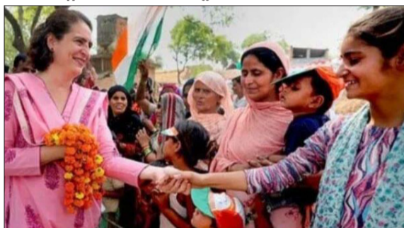
■ ವಿಜಯಸಾಕ್ಷಿ ಸುದ್ದಿ, ನವದೆಹಲಿ

ಪ್ರಧಾನಿ ನರೇಂದ್ರ ಮೋದಿ ಜನರ ಕಷ್ಟಗಳನ್ನು ಕೇಳುತ್ತಿಲ್ಲ. ಅಪ್ರಸ್ತುತ ವಿಷಯಗಳನ್ನು ಮಾತನಾಡುತ್ತಿದ್ದಾರೆ ಎಂದು ಕಾಂಗ್ರೆಸ್ ಪ್ರಧಾನ ಕಾರ್ಯದರ್ಶಿ ಪ್ರಿಯಾಂಕಾ ಗಾಂಧಿ ವಾದ್ಯಾ ವಾಗ್ಧಾಳಿ ನಡೆಸಿದ್ದಾರೆ.