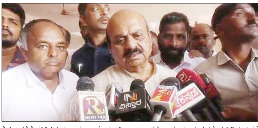
ಕೇಂದ್ರ ಪ್ರಶ್ನೆಗೆ ಪ್ರತಿಕ್ರಿಯಿಸಿದ ಬಸವರಾಜ ಬೊಮ್ಮಾಯಿ, ರಾಜ್ಯದಲ್ಲಿ ಕಾನೂನು ಸುವ್ಯವಸ್ಥೆ ಕುಸಿದಿರುವುದಕ್ಕೆ

■ ವಿಜಯಸಾಕ್ಷಿ ಸುದ್ದಿ, ಹಾವೇರಿ ರಾಜ್ಯ ಸರ್ಕಾರವು ಕೇಂದ್ರ ಸರ್ಕಾರ ನೀಡಿದ ಬರ ಪರಿಹಾರದಲ್ಲಿ 2 ಸಾವಿರ ರೂ. ಕಡಿತ ಮಾಡಿ ನೀಡುತ್ತಿದ್ದು, ಬರ ಪರಿಹಾರವನ್ನು ಸಾಲಕ್ಕೆ ಹೊಂದಾಣಿಕೆ ಮಾಡಿ ರೈತರಿಗೆ ದೊಡ್ಡ ಅನ್ಯಾಯ ಮಾಡುತ್ತಿದೆ ಎಂದು ಮಾಜಿ ಮುಖ್ಯಮಂತ್ರಿ ಬಸವರಾಜ ಬೊಮ್ಮಾಯಿ ಆರೋಪಿಸಿದರು. ಹಾವೇರಿಯಲ್ಲಿ ಮಾಧ್ಯಮಗಳೊಂದಿಗೆ ಮಾತನಾಡಿದ ಅವರು, ರಾಜ್ಯ ಸರ್ಕಾರ ಬರ ಪರಿಹಾರವಾಗಿ ಕೊಟ್ಟಿದ್ದೇ 2 ಸಾವಿರ. ಈಗ ಅದರಲ್ಲೂ ಕಡಿತ ಮಾಡಿ ರೈತರ ಖಾತೆಗೆ ಹಣ ನೀಡುತ್ತಿದ್ದಾರೆ. ಅಲ್ಲದೇ ಕೇಂದ್ರ ಸರ್ಕಾರ ಪರಿಹಾರ ನೀಡಿರುವ ಹಣವನ್ನು ರೈತರ ಸಾಲಕ್ಕೆ ಹೊಂದಾಣಿಕೆ ಮಾಡುತ್ತಿದ್ದಾರೆ. ರೈತರು ಸಂಕಷ್ಟದಲ್ಲಿ ಇದ್ದಾರೆ ಎನ್ನುವ ಕಾರಣಕ್ಕೆ ಪರಿಹಾರ ನೀಡುವುದು. ಈಗ ಅದನ್ನೂ ಸಾಲಕ್ಕೆ ಹೊಂದಾಣಿಕೆ ಮಾಡಿದರೆ, ಅದು ಹೇಗೆ ಪರಿಹಾರವಾಗುತ್ತದೆ ಎಂದು ಪ್ರಶ್ನಿಸಿದರು. ರಾಜ್ಯ ಸರ್ಕಾರಕ್ಕೆ ರೈತರಿಗೆ ಸಹಾಯ ಮಾಡುವ ಮನಸ್ಸಿಲ್ಲ. ಕಾಂಗ್ರೆಸ್ ಚುನಾವಣಾ ಘೋಷಣಾ ಪತ್ರದಲ್ಲಿ ಹೇಳಿರುವಂತೆ ರೈತರ ಸಾಲ ಮನ್ನಾ ಮಾಡಲಿ, ಕಾಂಗ್ರೆಸ್ ಘೋಷಣಾ ಪತ್ರ ಕರ್ನಾಟಕದಿಂದ ಪ್ರಾರಂಭವಾಗಲಿ ಎಂದು ಆಗ್ರಹಿಸಿದರು. ಇನ್ನು ಹುಬ್ಬಳ್ಳಿಯಲ್ಲಿ ಮತ್ತೊಬ್ಬ ಯುವತಿಯ ಹತ್ಯೆಯಾಗಿರುವ ಪ್ರಕರಣದ ಕುರಿತು ಪತ್ತೆದಳಿಸಿದರು.