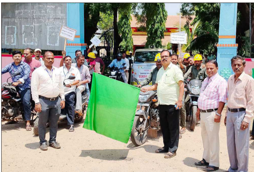
ಒಳಗಾಗದೇ ವಿವೇಚನೆಯಿಂದ ಅರ್ಹರೆಲ್ಲರೂ ಮತ ಚಲಾಯಿಸಬೇಕು. ಪ್ರಜಾಪ್ರಭುತ್ವ ಗಟ್ಟಿಗೊಳಿಸಲು ಮತದಾನ ಮಾಡಿ ಎಂದರು.