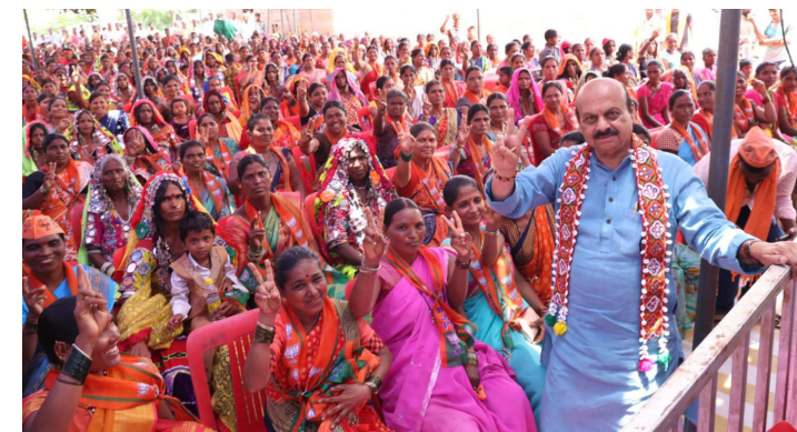
ತಾಂಡಾ ಅಭಿವೃದ್ಧಿ ಗೆ ಬಿಜೆಪಿ ಕಾರಣ

ಕಾಂಗ್ರೆಸ್ ನ ಒಬ್ಬ ನಾಯಕರು ಬಂಜಾರ ಸಮುದಾಯವನ್ನು ಎಸ್ಸಿ ಪಟ್ಟಿಯಿಂದ ಕೈ ಬಿಡಬೇಕು ಎಂದು ಸುಪ್ರೀಂ ಕೋರ್ಟ್ ಗೆ ಹೋಗಿದ್ದರು.