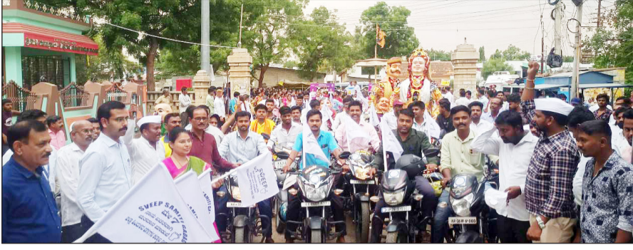
ನಿಟ್ಟಿನಲ್ಲಿ ಎಲ್ಲರೂ ಸಹಕರಿಸಬೇಕು. ಮತದಾನವನ್ನು ಹಬ್ಬದ ರೀತಿಯಲ್ಲಿ ಆಚರಿಸುವ ಮೂಲಕ ಪ್ರತಿಯೊಬ್ಬರೂ ಪಾಲ್ಗೊಳ್ಳಬೇಕು ಎಂದು ತಿಳಿಸಿದರು.