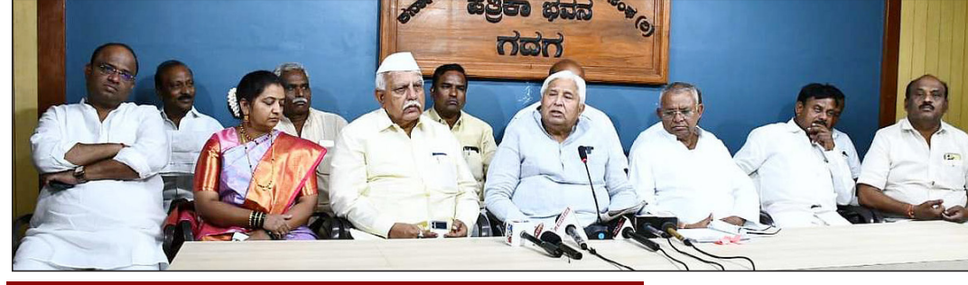
ಎಚ್.ಕೆ. ಪಾಟೀಲರ ಕ್ಷಮೆ ಕೇಳಲಿ

■ ವಿಜಯಸಾಕ್ಷಿ ಸುದ್ದಿ, ಗದಗ ಪ್ರಧಾನಿ ನರೇಂದ್ರ ಮೋದಿ ಕಳೆದ 10 ವರ್ಷಗಳಲ್ಲಿ ಕರ್ನಾಟಕ ಪ್ರವಾಸೋದ್ಯಮ ಅಭಿವೃದ್ಧಿಗೆ ಸಂಬಂಧಿಸಿದ 9 ಯೋಜನೆಗಳ ಪೈಕಿ 8 ಯೋಜನೆಗಳಿಗೆ ಅನುದಾನ ನೀಡದೆ ಕರ್ನಾಟಕ ಪ್ರವಾಸೋದ್ಯಮ ಕ್ಷೇತ್ರಕ್ಕೆ ಬಹುದೊಡ್ಡ ದೊಡ್ಡ ಮಾಡಿದ್ದಾರೆ ಎಂದು ಕಾನೂನು ಹಾಗೂ ಪ್ರವಾಸೋದ್ಯಮ ಇಲಾಖೆ ಸಚಿವ ಎಚ್.ಕೆ. ಪಾಟೀಲ ಆರೋಪಿಸಿದರು. ನಗರದ ಪತ್ರಿಕಾ ಭವನದಲ್ಲಿ ಸೋಮವಾರ ನಡೆದ ಪತ್ರಿಕಾಗೋಷ್ಠಿಯಲ್ಲಿ ಮಾತನಾಡಿದ ಸಚಿವರು, ಪ್ರಧಾನಿ ಮೋದಿ ಚುನಾವಣೆ ಪ್ರಚಾರಕ್ಕೆ ಬಂದ ಸಂದರ್ಭದಲ್ಲಿ ಮೈಸೂರು, ಬಾನ್ಸೂರಿ ಹಾಗೂ ಹಂಪಿ ಕ್ಷೇತ್ರಗಳನ್ನು ಜಾಗತಿಕ ಪ್ರವಾಸಿ ತಾಣವಾಗಿಸುವುದಾಗಿ ಹೇಳಿಕೆ ನೀಡಿದ್ದಾರೆ. ಆದರೆ ಈಗಾಗಲೇ ಅವು ವಿಶ್ವ ಪಾರಂಪರಿಕ ತಾಣಗಳ ಪಟ್ಟಿಯಲ್ಲಿ ಸ್ಥಾನ ಪಡೆದಿವೆ. ಅವುಗಳ ಅಭಿವೃದ್ಧಿಗೆ ಇನ್ನಷ್ಟು ಒತ್ತು ಸಿಗಬೇಕಾಗಿರುವುದು ನಿಜವಾದರೂ, 10 ವರ್ಷಗಳಲ್ಲಿ ಕರ್ನಾಟಕ ಪ್ರವಾಸೋದ್ಯಮ ಅಭಿವೃದ್ಧಿಯನ್ನು ನಿರ್ಲಕ್ಷಿಸಿ, ಈಗ ಆದರೆ