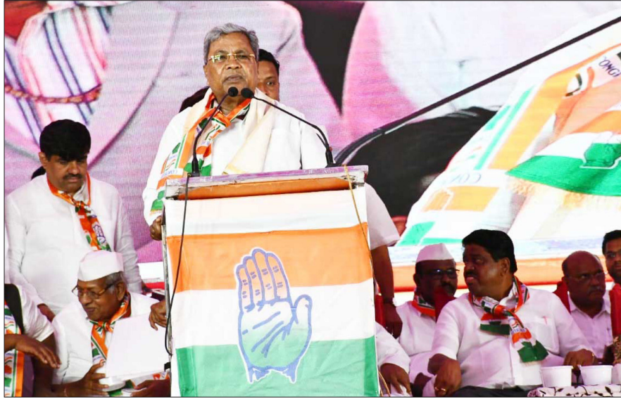
ಕೇಂದ್ರ ಸರ್ಕಾರದ ಪರ ವಕೀಲರು ನೀರೇಕ್ಷೆಯಿದೆ. ಆದರೆ ಈವರೆಗೂ ಬರ ಪರಿಹಾರ ಮತ್ತು ಕೇಳಿದ್ದ ಕಾಲಾವಕಾಶ ಮುಗಿಯುತ್ತಾ ಹಣ ಬಂದಿಲ್ಲ ಎಂದು ಸಿಎಂ ಕೇಂದ್ರ ಸರ್ಕಾರದ ಮಲತಾಯಿ ಬಂದಿದ್ದು, ಅನುದಾನ ಬರುವ ಸಿದ್ದರಾಮಯ್ಯ ಹೇಳಿದರು.

■ ವಿಜಯಸಾಕ್ಷಿ ಸುದ್ದಿ, ಗದಗ ರಾಜ್ಯದ 223 ತಾಲೂಕುಗಳು ಬರದಿಂದ ತತ್ತರಿಸಿವೆ. ಬರ ಪರಿಹಾರ ಕೊಡುವಂತೆ 2023ರ ಸೆಪ್ಟೆಂಬರ್‌ನಲ್ಲಿ ಸರ್ಕಾರ ಮನವಿ ಮಾಡಿತ್ತು. ಅಕ್ಟೋಬರ್ 40ನೇ 9ರವರೆಗೆ ಕೇಂದ್ರ ತಂಡ ಅಧ್ಯಯನ ನಡೆಸಿ, ವರದಿ ನೀಡಿದರೂ ಪ್ರಧಾನಿ ಮೋದಿ ಪರಿಹಾರ ಕೊಡಲಿಲ್ಲ. ಅಷ್ಟೇ ಅಲ್ಲದೆ, 2019ರಲ್ಲಿ ಭೀಕರ ಪ್ರವಾಹ ಬಂದಾಗ ಯಡಿಯೂರಪ್ಪ ಮುಖ್ಯಮಂತ್ರಿಯಾಗಿದ್ದರೂ ಆಗಲೂ ಕರ್ನಾಟಕದ ಮುಖ ನೋಡದ ಪ್ರಧಾನಿ ಮೋದಿ ಈಗ ಚುನಾವಣೆ ಪ್ರಚಾರಕ್ಕೆ ಪದೇ ಪದೇ ಕರ್ನಾಟಕ ಬರುತ್ತಿದ್ದಾರೆ. ಅವರಿಗೆ ಕರ್ನಾಟಕದ ಜನರ