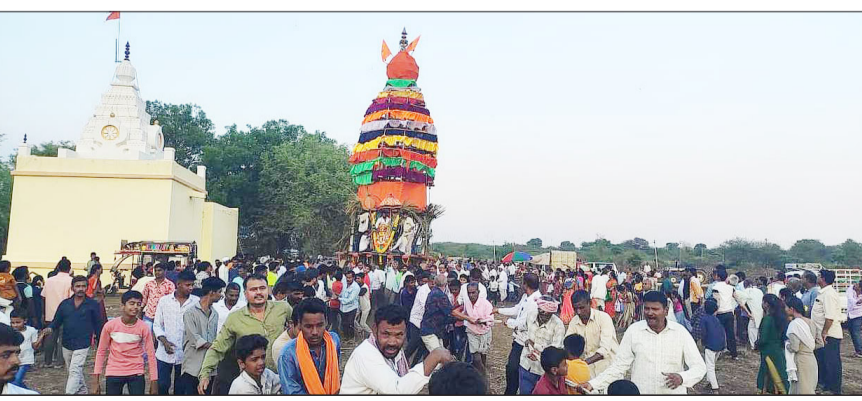
ಮುಳುಗುಂದ ಪಟ್ಟಣದಲ್ಲಿ ಅಲ್ಲಮ ಪ್ರಭುಸ್ವಾಮಿ ರಥೋತ್ಸವವು ಮಂಗಳವಾರ ಸಾವಿರಾರು ಭಕ್ತರ ಸಮ್ಮುಖದಲ್ಲಿ ಸಂಭ್ರಮದಿಂದ ಜರುಗಿತು.