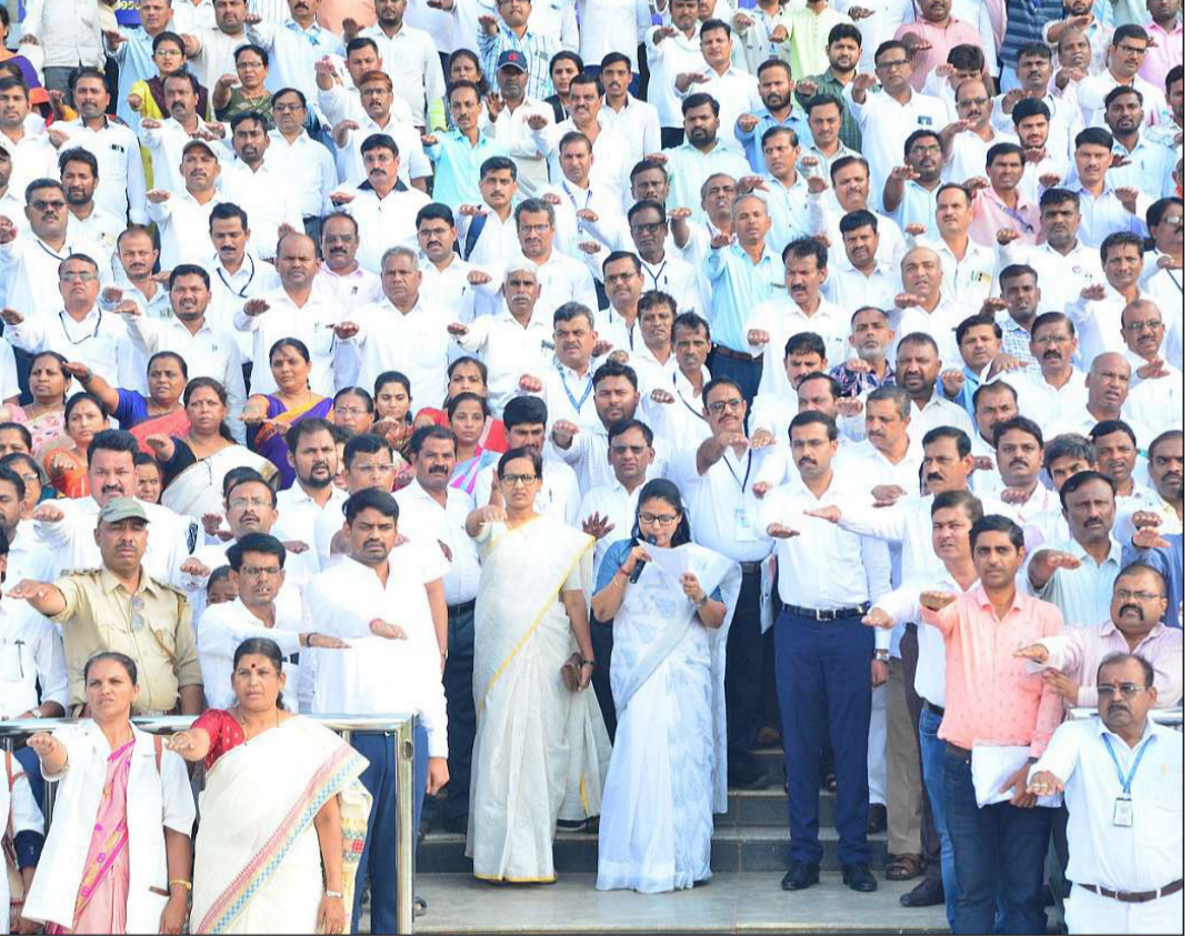
ದೇಶದ ಪ್ರಜಾಸತ್ತಾತ್ಮಕ ಸಂಪ್ರದಾಯಗಳು ತಾಂತ್ರಿಕ ಚುನಾವಣೆಗಳ ಘನತೆಯನ್ನು ಚುನಾವಣೆಯಲ್ಲಿ ನಿರ್ಭೀತರಾಗಿ ಮತ್ತು ಮುಕ್ತ, ನ್ಯಾಯಸಮ್ಮತ ಮತ್ತು ಎತ್ತಿ ಹಿಡಿಯುತ್ತೇವೆ ಮತ್ತು ಪ್ರತಿಯೊಂದು ಧರ್ಮ, ಜನಾಂಗ, ಜಾತಿ, ಮತ, ಭಾಷೆ