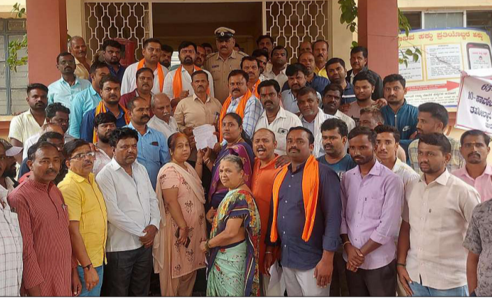
ಕಾಲಹರಣ ಮಾಡದೇ ಶೀಘ್ರವೇ ಉಗ್ಗು ಶಿಕ್ಷೆ ವಿಧಿಸಬೇಕು, ಹೇಣ್ಣು ಮಕ್ಕಳು ಕಾಲೇಜಿಗೆ ಹೋಗದಂತಹ ವಾತಾವರಣ ನಿರ್ಮಾಣವಾಗುತ್ತಿದೆ. ಇಂತಹ ಘಟನೆಗಳು ಮರುಕಳಿಸದಂತೆ ಸರಕಾರ ಎಚ್ಚರಿಕೆ ವಹಿಸಬೇಕು ಎಂದು ಆಗ್ರಹಿಸಿದರು.