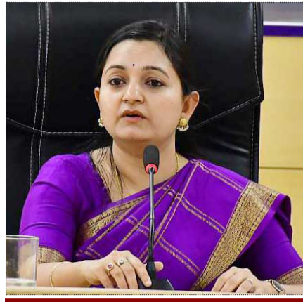
ವಿಫಲ ಕೊಳವೆ ಬಾವಿ ಮುಚ್ಚಿಸಿ