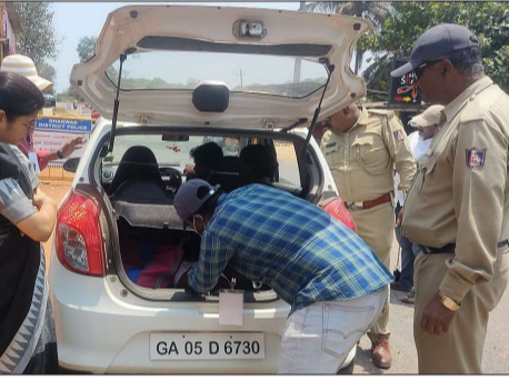
ವಿಜಯಸಾಕ್ಷಿ ಸುದ್ದಿ, ಧಾರವಾಡ