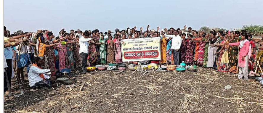
ಒಳಗಾಗದೇ ಮತ ಚಲಾಯಿಸಿ ಎಂದರು. ಕಾರ್ಯದಲ್ಲಿ ತಪ್ಪದೇ ಪಾಲ್ಗೊಳ್ಳಬೇಕು. ಸಂವಿಧಾನಾತ್ಮಕ ಹಕ್ಕಾದ ಮತದಾನ ತಾಲೂಕಿನ ಗ್ರಾಮೀಣ ಪ್ರದೇಶದ ಉದ್ಯೋಗ