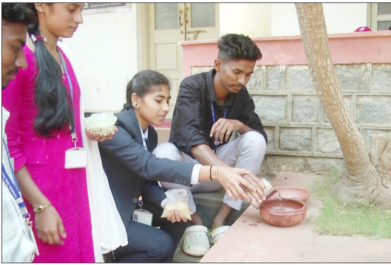
■ ವಿಜಯಸಾಕ್ಷಿ ಸುದ್ದಿ, ಗದಗ

ಎಲ್ಲ ನೋಡಿದರಲ್ಲಿ ಬೇಸಿಗೆಯ ಬೇಗೆ ಹೆಚ್ಚುತ್ತಲೇ ಇದೆ. ಕೆಂಡದಂಥ ಬಿಸಿಲಿನ ಝಳಕ್ಕೆ ರಾಜ್ಯದ ಜನ ವೈರಾಣಾಗುತ್ತಿದ್ದಾರೆ. ನೀರಿನ ಕೊರತೆ ಒಂದೆಡೆ ಸಂಕಷ್ಟ ತಂದೊಡ್ಡುತ್ತಿದ್ದರೆ, ಬೆಳಿಗ್ಗೆ 10ರ ನಂತರ ಹೊರಗೆಲ್ಲೂ ತಲೆಯೆತ್ತಿ ಓಡಾಡಲೂ ಆಗದಂತ ಪರಿಸ್ಥಿತಿ ಎದುರಾಗಿದೆ. ಸಾಕ್ಷಾತ್ಕಾರವೆಂದು ಮೇಲೆ ಕೂತ ಅನುಭವವಾಗುತ್ತಿದೆ. ಅಭಿವೃದ್ಧಿಯ ನಾಗಾಲೋಟದಲ್ಲಿರುವ ಮನುಷ್ಯ ಈ ಎಲ್ಲವುಗಳಿಗೂ ಏನಾದರೂಂದು ತಾತ್ಕಾಲಿಕ