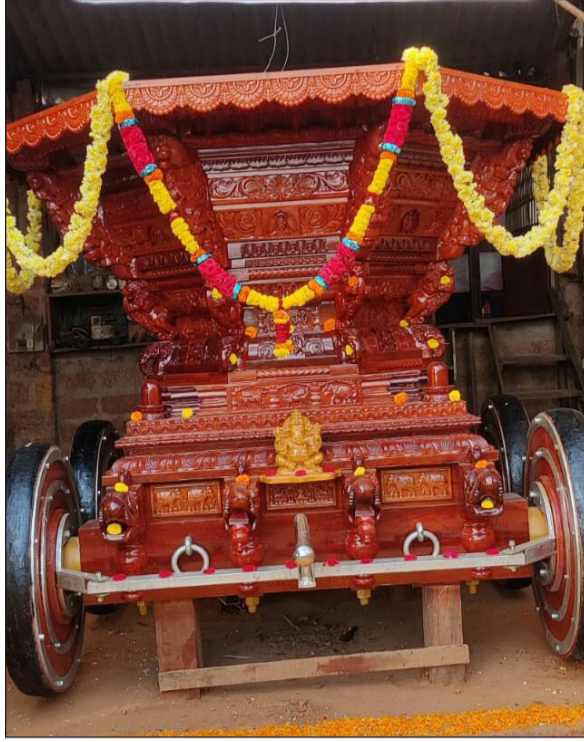
ರೀತಿಯ ಸಂಪ್ರದಾಯ ರಾಜ್ಯದಲ್ಲಿಯೇ ವಿಶೇಷ ಹಾಗೂ ಪ್ರಥಮ ಎಂದು ಹೇಳಲಾಗುತ್ತಿದೆ.

ಜಾತಿ, ಧರ್ಮಗಳ ನಡುವೆ ಕಂದಕ ಸೃಷ್ಟಿ ಮಾಡಿ ವೈಯಕ್ತಿಕ ಬೆಳೆ ಬೇಯಿಸಿಕೊಳ್ಳುತ್ತಿರುವವರ ನಡುವೆ 'ದೇವನೊಬ್ಬ ನಾಮ ಹಲವು' ಎಂಬರ್ಥದಲ್ಲಿ ನಂಬಿಕೆಯನ್ನಿಟ್ಟಿರುವ ಮುಸ್ಲಿಂ ವ್ಯಕ್ತಿಯೊಬ್ಬರು ಹಿಂದೂ ದೇವಸ್ಥಾನಕ್ಕೆ ಹೊಸ ತೇರು ನಿರ್ಮಿಸಿಕೊಟ್ಟಿದ್ದಾರೆ. ಅಲ್ಲದೆ ಪ್ರತಿ ವರ್ಷ ಜಾತ್ರಾ ಮಹೋತ್ಸವದ ತೇರನ್ನು ಎಲ್ಲ ಸಮಾಜದ ಗುರು-ಹಿರಿಯರು ಸೇರಿ ಒಂದಾಗಿ ಎಳೆಯುವುದಕ್ಕಾಗಿ ತೇರಿನ ಹಗ್ಗ ಮತ್ತು ಕಳಶವನ್ನು ಅರ್ಪಣೆ ಬಡಾವಣೆಯ ಹಜರತ್ ಮಹಬೂಬಸುಭಾನಿ ದರ್ಗಾದಿಂದ ಶ್ರೀಮಠದವರೆಗೆ ಮೆರವಣಿಗೆ ಮೂಲಕ ತೆಗೆದುಕೊಂಡು ಹೋಗುವುದು, ಜಾತ್ರೆ ಮುಗಿದ ಬಳಿಕ ದರ್ಗಾದ ಭಕ್ತರು ಮತ್ತೆ ಹಗ್ಗ, ಕಳಶವನ್ನು ದರ್ಗಾಕ್ಕೆ ತೆಗೆದುಕೊಂಡು ಬರುವ ಹೊಸ ಪ್ರೀತಿ, ಧಾರ್ಮಿಕ ಭಾವೈಕ್ಯತೆಗೆ ಮುಂದಡಿ ಇಟ್ಟಿದ್ದಾರೆ. ಈ