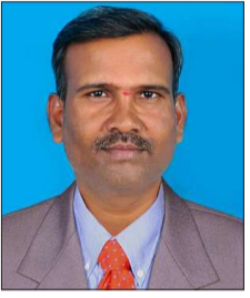
- ಈಶ್ವರ ಕುರಿ (ಜಕ್ಕಲಿ)

ವರ್ಗ ಕೋಣೆಗಳಲ್ಲಿ ಅಧ್ಯಾಪಕರು ಬೋಧಿಸಿದ ಪಾಠ ಪ್ರವಚನಗಳನ್ನು ನೆನಪಿಸಿಕೊಂಡು ಉತ್ತರಿಸಬೇಕು. ಒಂದು ಪರೀಕ್ಷೆ ಮುಗಿದ ಬಳಿಕ ಯಾವುದೇ ಕಾರಣಕ್ಕೂ ಆ ಪರೀಕ್ಷೆಯ ಕುರಿತು ತಮ್ಮ ಸ್ನೇಹಿತರ ಜೊತೆಗೆ ಯಾವುದೇ ತರಹದ ಚರ್ಚೆಗೆ ಅವಕಾಶ ನೀಡಬೇಡಿ. ಯಾಕೆಂದರೆ ನೀವು ಬರೆದ ಉತ್ತರಗಳು ಸರಿಯೋ ತಪ್ಪೋ...ಪರೀಕ್ಷೆ ಮುಗಿದು ಹೋಗಿರುತ್ತದೆ. ಚರ್ಚೆಯ ಬಳಿಕ ಬರೆದ ಉತ್ತರ ತಪ್ಪಾಗಿದ್ದರೆ ಮುಂದಿನ ಪರೀಕ್ಷೆಯ ಮೇಲೆ ಪರಿಣಾಮ ಬೀರುತ್ತದೆ. ಬೇಕಿದ್ದರೆ ಎಲ್ಲಾ ಪರೀಕ್ಷೆಗಳು ಮುಗಿದ ತದನಂತರವೇ ತೆರೆದು ನೋಡಿ. ಅಲ್ಲಿಯವರೆಗೂ ಪ್ರಶ್ನೆ ಪತ್ರಿಕೆಗಳ ಅವಲೋಕನ ಮಾಡುವುದು ಸರಿಯಲ್ಲ. ಪರೀಕ್ಷೆಯ ಬಗ್ಗೆ ಸಾಕಷ್ಟು ಮುನ್ನೆಚ್ಚರಿಕೆಯನ್ನು ವಹಿಸಿ ಬಹಳಷ್ಟು ಆನಂದದಿಂದ ಒಂದು ಹಬ್ಬದಂತೆ ಪರೀಕ್ಷೆಯನ್ನು ಯಶಸ್ವಿಯಾಗಿ ಬರೆಯೋಣ. ಏನಂತೀರಾ?!