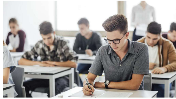
ಉತ್ತರಿಸಬಹುದು. ಪರಿಶಿಷ್ಟ ದಿನಗಳಿಗಾಗಿ ಎದುರು ನೋಡುತ್ತಿರುವ ವಿದ್ಯಾರ್ಥಿಗಳು ತೀವ್ರದೇಶದ ಪ್ರಮುಖ ಅಂಶಗಳು.