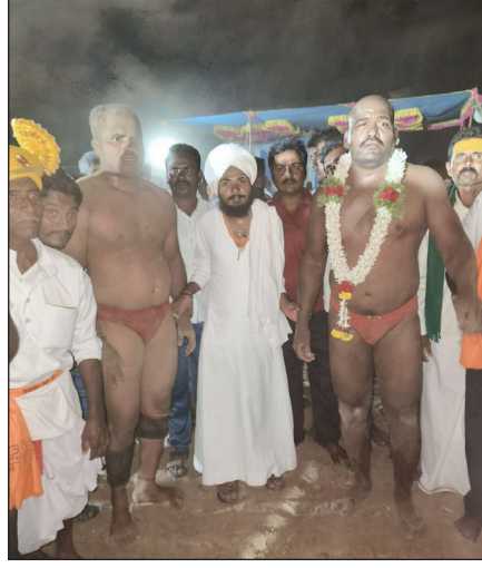
ಉತ್ತಮ ಸಂದರ್ಭದಲ್ಲಿ ನಡೆಸುವ ಇಂತಹ ಗ್ರಾಮೀಣ ಕ್ರೀಡೆಗಳನ್ನು ಪ್ರೋತ್ಸಾಹಿಸಬೇಕು ಎಂದರು.

ವಿಜಯಸಾಕ್ಷಿ ಸುದ್ದಿ, ಲಕ್ಷ್ಮೇಶ್ವರ ತಾಲೂಕಿನ ಆದ್ವೈಯಲ್ಲಿ ಗವಿ ಸಿದ್ಧೇಶ್ವರ ಜಾತ್ರಾ ಮಹೋತ್ಸವ ಅಂಗವಾಗಿ ರಾಜ್ಯ ಮಟ್ಟದ ಭಾರಿ ಜಂಗಿ ನಿಕಾಲ ಕುಸ್ತಿಗಳು ಜರುಗಿದವು.