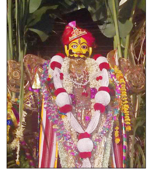
ಅದ್ದೂರಿ ಮೆರವಣಿಗೆಯು ನಡೆಯಲಿದ್ದು, ನಂತರ ಬಡಗೀರ ಓಣಿ, ಡಬಾಲಿ ಓಣಿ, ಕೆಳಗೇರಿ ಓಣಿ, ಶೆಟ್ಟರ ಓಣಿ ಸೇರಿದಂತೆ ಪ್ರಮುಖ ಬೀದಿಗಳಲ್ಲಿ ಸಂಚರಿಸಿ ಸೋಮವಾರ ಬೆಳಿಗಿನ ಜಾವ ಮತ್ತೆ ವಾಲ್ಮೀಕಿ ವೃತ್ತದಲ್ಲೇ ಕಾಮದಹನ ನಡೆಯಲಿದೆ. ಕಿವಿಡಚಿಕ್ಕುಪ್ಪ ಹಲಗೆಗಳ ಸದ್ಯ: ಬೃಹತ್ ಮೆರವಣಿಗೆಯು ದೃಕ್ಕೂ ಸಾವಿರಾರು ಸಂಖ್ಯೆಯಲ್ಲಿ ಯುವಕರು ಭಾಗಿಯಾಗಿ ಕಿವಿಡಚಿಕ್ಕುಪ್ಪ ರೀತಿಯಲ್ಲಿ ಹಲಗೆಗಳ ಸದ್ಯ ಮಾಡುತ್ತಾರೆ. ಯಾರು ಎಷ್ಟೇ ಹೇಳಿದರೂ

ವಿಜಯಸಾಕ್ಷಿ ಸುದ್ದಿ, ಶಿರಹಟ್ಟಿ ಪುಟ್ಟಣದಲ್ಲಿ ಈ ಹಿಂದಿನಿಂದಲೂ ಸಂಪ್ರದಾಯದಂತೆ ವಿಶೇಷವಾಗಿ ಹುಲ್ಲಿನಿಂದ ತಯಾರಿಸಿದ ಬೃಹತ್ ಪುಲ್ಲಗಾಮನ ಮೆರವಣಿಗೆಯು ನಡೆಯುತ್ತಾ ಬಂದಿದ್ದು, ಇದೀಗ ಹೋಳಿ ಹಬ್ಬದ ಪ್ರಯುಕ್ತ ಮಾರ್.24ರ ರಾತ್ರಿ 10 ಗಂಟೆಯಿಂದ ಮಾರ್.25ರ ಸೋಮವಾರ ಬೆಳಿಗಿನ ಜಾವದವರೆಗೆ ಪುಟ್ಟಣದ ಪ್ರಮುಖ ಬೀದಿಗಳಲ್ಲಿ ಪುಲ್ಲಗಾಮನ ಬೃಹತ್ ಮೆರವಣಿಗೆಯು ನಡೆಯಲಿದೆ. ಅಲಂಕೃತ ಮಂಟಪದಲ್ಲಿ ಕಾಮನ ಮೆರವಣಿಗೆ: ರವಿವಾರ ರಾತ್ರಿ 10ಗಂಟೆ ಸುಮಾರಿಗೆ ಪುಟ್ಟಣದ ಶ್ರೀ ಮಹರ್ಷಿ ವಾಲ್ಮೀಕಿ ವೃತ್ತದಿಂದ ವಿಶೇಷವಾಗಿ ತಯಾರಿಸಿದಂತಹ ಪುಲ್ಲಗಾಮನ ಮೆರವಣಿಗೆಯು ಪ್ರಾರಂಭವಾಗಲಿದ್ದು, ಕಾಮನ ಮೂರ್ತಿಗೆ ವಿಶೇಷ ಅಲಂಕಾರ ಮತ್ತು ವೇಷಭೂಷಣಗಳನ್ನು ತೊಡಿಸಲಾಗುತ್ತದೆ. ಅಲಂಕೃತ ಎತ್ತುಗಳ ಬಂಡಿಯನ್ನು ಸಹ ಹಸಿರು ತೋರಣಗಳಿಂದ ಸಿಂಗರಿಸಿ ಪುಲ್ಲಗಾಮನ