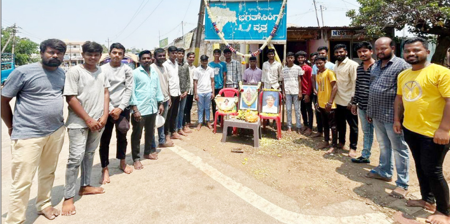
ವಿಜಯಸಾಕ್ಷಿ ಸುದ್ದಿ, ಗದಗ