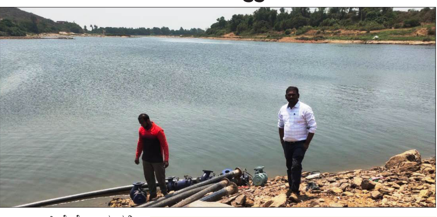
ಅಣಜೇಗೆರೆ ಗ್ರಾಮದಲ್ಲಿ 3 ದಿನಗಳಿಗೊಮ್ಮೆ ನೀರು ಬಿಡುತ್ತಿದ್ದು, ಗ್ರಾಮಸ್ಥರು ನೀರಿಗಾಗಿ ಪರದಾಡುವಂತಾಗಿದೆ.

ವಿಜಯಸಾಕ್ಷಿ ಸುದ್ದಿ, ಪರಪನಹಳ್ಳಿ ದಿನಗಳು ಕಳೆದಂತೆ ಬೆಳಿಗ್ಗೆಯ ಧಗೆ ಹೆಚ್ಚುತ್ತಿದ್ದು, ನೀರಿನ ಸಮಸ್ಯೆ ಕಗ್ಗಂಟಾಗಿ ತಲೆದೋರಿದೆ. ತಾಲೂಕಿನ 64ಕ್ಕೂ ಅಧಿಕ ಕಡೆಗಳಲ್ಲಿ ನೀರಿನ ಸಮಸ್ಯೆ ಉಲ್ಬಣಗೊಂಡಿದ್ದು, ಅಣಜೇಗೆರೆ ಪಂಚಾಯತಿ ವ್ಯಾಪ್ತಿಯ ಹುಣಸೀಕಟ್ಟೆ, ಶ್ರೀನಿವಾಸಪುರ, ಅಣಜೇಗೆರೆ, ಉಚ್ಚಂಗಿದುರ್ಗ, ಚಟ್ಟೀಹಳ್ಳಿ, ಮಾದಿಹಳ್ಳಿ, ಯು ಕಲ್ಲಹಳ್ಳಿ ಸೇರಿದಂತೆ ಜಗಜಾರು ವಿಧಾನಸಭಾ ವ್ಯಾಪ್ತಿಗೆ ಒಳಪಡುವ 7 ಗ್ರಾಮ ಪಂಚಾಯತಿಗಳಲ್ಲಿ ನೀರಿನ ಸಮಸ್ಯೆ ಏಪರಿತವಾಗಿದೆ.