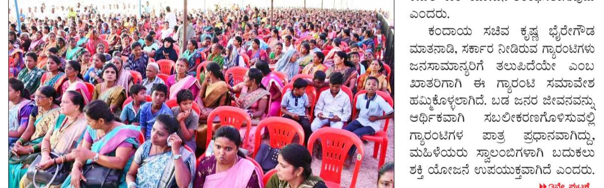
ಕೆಎಲ್ ಕಾರ್ ಯೋಜನೆ ಆರಂಭಿಸಲಾಗುವುದು ಎಂದರು. ಕಂದಾಯ ಸಚಿವ ಕೃಷ್ಣ ಭೈರೇಗೌಡ ಮಾತನಾಡಿ, ಸರ್ಕಾರ ನೀಡಿರುವ ಗ್ಯಾರಂಟಿಗಳು ಜನಸಾಮಾನ್ಯರಿಗೆ ತಲುಪಿದೆಯೇ ಎಂಬ ಖಾತರಿಗಾಗಿ ಈ ಗ್ಯಾರಂಟಿ ಸಮಾವೇಶ ಹಮ್ಮಿಕೊಳ್ಳಲಾಗಿದೆ. ಬಡ ಜನರ ಜೀವನವನ್ನು ಆರ್ಥಿಕವಾಗಿ ಸಬಲೀಕರಣಗೊಳಿಸುವಲ್ಲಿ ಗ್ಯಾರಂಟಿಗಳ ಪಾತ್ರ ಪ್ರಧಾನವಾಗಿದ್ದು, ಮಹಿಳೆಯರು ಸ್ವಾಲ್ಪಬಿಗ್ಗಳಾಗಿ ಬದುಕಲು ಶಕ್ತಿ ಯೋಜನೆ ಉಪಯುಕ್ತವಾಗಿದೆ ಎಂದರು. >>> 3ನೇ ಪುಟಕ್ಕೆ

ವಿರೋಧ ಪಕ್ಷದವರ ಅಧಿಕಾರಾವಧಿಯಲ್ಲಿ ಹಣದುಬ್ಬರ ಹೆಚ್ಚಾಗಿ ಶ್ರೀಮಂತರ ತೆರಿಗೆಯನ್ನು ಕಡಿಮೆಗೊಳಿಸಿ, ಜನಸಾಮಾನ್ಯರ ಮೇಲೆ ತೆರಿಗೆಯನ್ನು ಹೆಚ್ಚು ಮಾಡಿ, ದಿನನಿತ್ಯದ ಜೀವನದ ಮೇಲೆ ಬರೆ ಎಳೆದ ಸಂದರ್ಭದಲ್ಲಿ ಗ್ಯಾರಂಟಿ ಯೋಜನೆಗಳ ಮೂಲಕ ಪ್ರತಿ ಕುಟುಂಬಕ್ಕೆ ನೇರವಾಗಿ ಅಥವಾ ಪರೋಕ್ಷವಾಗಿ ಪ್ರತಿ ತಿಂಗಳು 4-5 ಸಾವಿರ ರೂ ಆರ್ಥಿಕ ಹೊರೆಯನ್ನು ಕಡಿಮೆ ಮಾಡುವಲ್ಲಿ ಗ್ಯಾರಂಟಿ ಯೋಜನೆಗಳ ಪಾತ್ರ ಹೆಚ್ಚಿದೆ. - ಕೃಷ್ಣ ಭೈರೇಗೌಡ. ಕಂದಾಯ ಸಚಿವರು.