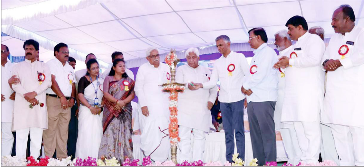
■ ವಿಜಯಸಾಕ್ಷಿ ಸುದ್ದಿ, ರೋಣ

ಚುನಾವಣಾ ಪೂರ್ವದಲ್ಲಿ ಗ್ಯಾರಂಟಿ ಕಾರ್ಡ್‌ಗಳನ್ನು ಮನೆ ಮನೆಗೆ ತಲುಪಿಸಿದ್ದವು. ಜನಾಭಿವೃದ್ಧಿ ಇಲಾಖೆಯ ಜಿಲ್ಲಾ ಅಧಿಕಾರಿಗಳಿಗೆ ಗ್ಯಾರಂಟಿ ಯೋಜನೆಗಳ ಸಲಹೆಗಳನ್ನು ಸಹ ಮನೆ ಮನೆಗೆ ತಲುಪಿಸಿದ್ದೇವೆ. ಕಾಂಗ್ರೆಸ್ ಪಕ್ಷದ ಮೇಲೆ ಜನರಿಗೆ ಇರುವ ವಿಶ್ವಾಸ ಬಹುದೋಡ್ಡದು.