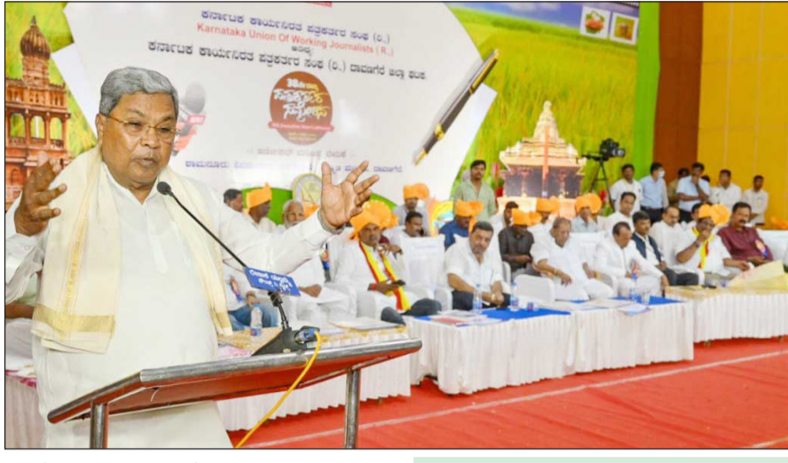
ಪತ್ರಿಕೋದ್ಯಮ ಸಿಲುಕಿದೆ. ಹೀಗಾಗಿ ಶ್ರೀಮಂತರ ಹಿತಾಸಕ್ತಿ ಕಾಯುವ, ಬಡವರ ಹಿತಾಸಕ್ತಿಗೆ ವಿರುದ್ಧವಾಗಿ ಬರೆಯುವ ಅಪಾಯ ಇರುತ್ತದೆ. ಇದನ್ನು ಪರಿಶೀಲಿಸಿಕೊಳ್ಳಿ, ನಾನು ಅಭಿವ್ಯಕ್ತಿ ಸ್ವಾತಂತ್ರ್ಯದ ಪರವಾಗಿ ಇರುವವನು, ಬೆಂಬಲಿಸುವವನು. ಅಭಿವ್ಯಕ್ತಿ ಸ್ವಾತಂತ್ರ್ಯಕ್ಕೆ ಘನತೆ ತರುವಂತೆ ಮಾಡಬೇಕು ಎಂದು ವಿನಂತಿಸಿದರು. ಸ್ವಾತಂತ್ರ್ಯಪೂರ್ವದ ಪತ್ರಿಕೋದ್ಯಮದಲ್ಲಿ ದೇಶಕ್ಕೆ ಸ್ವಾತಂತ್ರ್ಯ ತರಬೇಕು ಎನ್ನುವ ಆಶಯ ಪ್ರಧಾನವಾಗಿ ಕೆಲಸ ಮಾಡಿತ್ತು. ಸ್ವಾತಂತ್ರ್ಯಾನಂತರ

■ ವಿಜಯಸಾಕ್ಷಿ ಸುದ್ದಿ, ದಾವಣಗೆರೆ ಮೌಢ್ಯ, ಕಂದಾಚಾರ, ಕರ್ಮ ಸಿದ್ಧಾಂತವನ್ನು ಪತ್ರಕರ್ತರು ತಿರಸ್ಕರಿಸಿ ಜನರಿಗೆ ಸತ್ಯ ಹೇಳುವ ಧೈರ್ಯ ಬೆಳೆಸಿಕೊಳ್ಳಬೇಕು ಎಂದು ಮುಖ್ಯಮಂತ್ರಿ ಸಿದ್ದರಾಮಯ್ಯ ಕರೆ ನೀಡಿದರು. ದಾವಣಗೆರೆಯಲ್ಲಿ 38ನೇ ರಾಜ್ಯ ಪತ್ರಕರ್ತರ ಸಮ್ಮೇಳನವನ್ನು ಉದ್ಘಾಟಿಸಿ ಅವರು ಮಾತನಾಡಿದರು. ಪತ್ರಕರ್ತರಿಗೆ ರಾಜಕೀಯ ಬೇಕಾಗಿಲ್ಲ. ವಸ್ತುನಿಷ್ಠವಾಗಿ ಇರಬೇಕು. ನಾಡಿನ ಬಡವರು ಮತ್ತು ಮಧ್ಯಮ ವರ್ಗದವರ ಆರ್ಥಿಕ ಶಕ್ತಿ ಹೆಚ್ಚಿಸುವ ಗ್ಯಾರಂಟಿ ಯೋಜನೆಗಳನ್ನು ಪತ್ರಕರ್ತರು ಬಿಟ್ಟು ಗ್ಯಾರಂಟಿ ಎಂದು ಕರೆಯಬೇಕು. ಇದನ್ನು ಈ ಯೋಜನೆಯನ್ನು ಬಿಟ್ಟು ಗ್ಯಾರಂಟಿ ಎಂದು ಕರೆಯದೆ, ನೀವೇ ಪರಿಶೀಲಿಸಿ ಬರೆಯಿರಿ. ಏನನ್ನಾದರೂ ಪ್ರಕಟಿಸುವ ಮೊದಲು ಪರಿಶೀಲನೆ ನಡೆಸಿ ಎಂದು ಸಲಹೆ ನೀಡಿದರು. ಪಟ್ಟಭದ್ರರನ್ನು ಗುರುತಿಸಿ ಮಟ್ಟ ಹಾಕುವ ನಿಷ್ಠುರತೆಯನ್ನು ಪತ್ರಕರ್ತರು ಬೆಳೆಸಿಕೊಳ್ಳಬೇಕು. ಗಂಡ-ಹೆಂಡತಿ ಜಗಳವನ್ನು ಇಡೀ ದಿನ ತೋರಿಸುವುದಕ್ಕಿಂತ, ಸಮಾಜದ ಬೆಳವಣಿಗೆ ಅಡ್ಡಿ ಆಗಿರುವ ಪಟ್ಟ ಭದ್ರರನ್ನು ಗುರುತಿಸಿ ಬರೆಯಿರಿ. ಇದರಿಂದ ಸಮಾಜಮುಖಿ ಪತ್ರಿಕೋದ್ಯಮ ಸಾಧ್ಯ ಎಂದು. ಹಣವಂತರು, ಅತೀ ಶ್ರೀಮಂತರ ಕೈಯಲ್ಲಿ