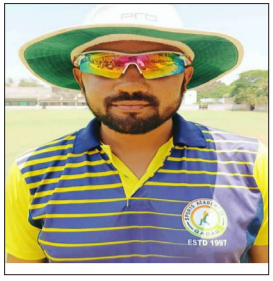
ಮುಧೋಳ ತಂಡಕ್ಕೆ ಪ್ರಮುಖ ಪಾತ್ರ ವಹಿಸಿದರು. ಉತ್ತರವಾಗಿ

■ ವಿಜಯಸಾಕ್ಷಿ ಸುದ್ದಿ, ಗದಗ ಹುಬ್ಬಳ್ಳಿಯಲ್ಲಿ ನಡೆಯುತ್ತಿರುವ ಸೆಕೆಂಡ್ ಡಿವಿಜನ್ ಕ್ರಿಕೆಟ್ ಲೀಗ್ ಪಂದ್ಯದಲ್ಲಿ ಗದಗ ತನ್ನ 3ನೇ ಗೆಲುವು ಸಾಧಿಸಿದೆ. ಟಾಸ್ ಗೆದ್ದು ಮೊದಲು ಬ್ಯಾಟ್ ಮಾಡಿದ ಗದಗ ತಂಡ 48.1 ಓವರ್‌ನಲ್ಲಿ 259 ರನ್ ಗಳಿಸಿತು. ಭರ್ಜರಿ ಬ್ಯಾಟಿಂಗ್ ಮೂಲಕ ಶತಕ ಸಿಡಿಸಿ 140 ರನ್ ಕಲಹಾಕಿದ ಅಸ್ಸಂ