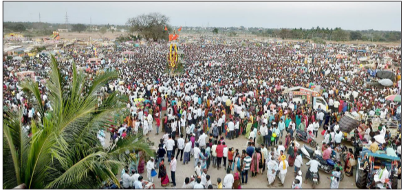
■ ವಿಜಯಸಾಕ್ಷಿ ಸುದ್ದಿ, ನರೇಗಲ್ಲ