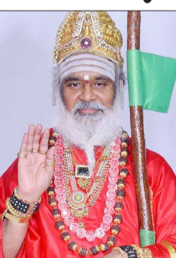
■ ವಿಜಯಸಾಕ್ಷಿ ಸುದ್ದಿ, ಲಕ್ಷ್ಮೀಶ್ವರ ಬಾಳೆಹೊನ್ನೂರಿನ