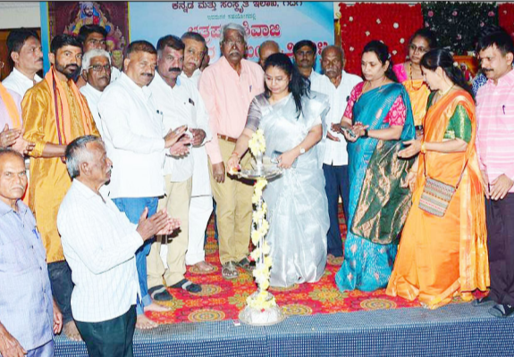
■ ವಿಜಯಸಾಕ್ಷಿ ಸುದ್ದಿ, ಗದಗ