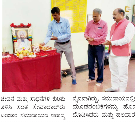
ಜೀವನ ಮತ್ತು ಸಾಧನೆಗಳ ಕುರಿತು ದೈವವಾಗಿದ್ದು, ಸಮುದಾಯದಲ್ಲಿನ ಮೂಡನಂಬಿಕೆಗಳನ್ನು ಹೊಡೆದೊಡಿಸಿದರು ಮತ್ತು ಹಲವಾರು