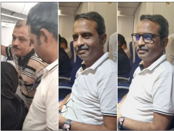
ಪ್ರಯಾಣಿಕನ ಪಾಲಿಗೆ ದೇವರು ಕಳುಹಿದ ರಕ್ಷಕರಾದರು.