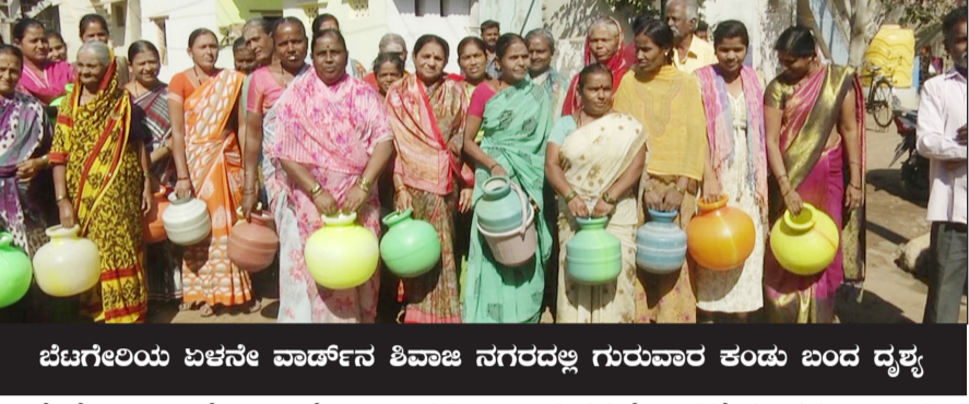
ಬೆಟಗೆರಿಯ ಏಟನೇ ವಾರ್ಡಿನ ಶಿವಾಜಿ ನಗರದಲ್ಲಿ ಗುರುವಾರ ಕಂಡು ಬಂದ ದೃಶ್ಯ

■ ವಿಜಯಸಾಕ್ಷಿ ಸುದ್ದಿ, ಗದಗ ಈ ಸಲದ ಮಳೆಗಾಲದಲ್ಲಿ ನೀರಿನೊಂದಿಗೆ ಮಳೆಯಾಗಲಿ, ಒಂದೆಡೆ ರೈತರು ಬರದ ಬಿಸಿಯಲ್ಲಿ ಈಗಾಗಲೇ ಸಾಕಷ್ಟು ನಷ್ಟ ಅನುಭವಿಸಿದ್ದಾರೆ. ಇನ್ನೊಂದೆಡೆ, ನೀರಿನೊಂದಿಗೆ ಬೇಸಿಗೆಯಲ್ಲಿ ತಲೆದೋರಬಹುದಾದ ನೀರಿನ ಅಭಾವದ ಆತಂಕ ಇನ್ನಷ್ಟು ನಿಚ್ಚಳವಾಗಿದೆ. ಇದಿನ್ನೂ ಬೇಸಿಗೆ ಪ್ರಾರಂಭವಾಗುವ ಮುನ್ನವೇ ಹಲವೆಡೆ ಜೀವಜಲಕ್ಕಾಗಿ ಹಾಹಾಕಾರ ಪ್ರಾರಂಭವಾಗಿದೆ. ಈ ಪರಿಸ್ಥಿತಿಗೆ ಗದಗ ಜಿಲ್ಲೆಯೂ ಹೊರತಾಗಿಲ್ಲ. ಬೇಸಿಗೆ ಆರಂಭಕ್ಕೂ ಮುನ್ನವೇ ಅವಳಿ ನಗರದ ಜನರು ನೀರಿಗಾಗಿ ಪರಿಶ್ರಮಿಸುತ್ತಿ ನಿರ್ಮಾಣವಾಗುತ್ತಿದೆ. ಅವಳಿ ನಗರದ ಬಹುತೇಕ ಬಡಾವಣೆಗಳಲ್ಲಿ ತಿಂಗಳಿಂದಲೇ ಕುಡಿಯುವ ನೀರಿನ ಅಭಾವ ತಲೆದೋರತೊಡಗಿದೆ. ನೀರು ಸರಬರಾಜಿನಲ್ಲಿ ವ್ಯತ್ಯಯವಾದ ಸಂದರ್ಭಗಳಲ್ಲಿ ಸಾರ್ವಜನಿಕರು ನಗರಸಭೆಗೆ ಮುತ್ತಿಗೆ ಹಾಕಿ ಪ್ರತಿಭಟನೆ ನಡೆಸಿದರೂ, ನಗರಾಡಳಿತ ಕೈಕಟ್ಟಿ ಕೊರುವಂತಾಗಿದೆ. ನಗರಸಭೆ ಕಿವಿ ಹಿಂಡಬೇಕಾದ ಜಿಲ್ಲಾಡಳಿತ ಕೂಡ ಮೌನಕ್ಕೆ ಶರಣಾಗಿರುವುದು ಸಾರ್ವಜನಿಕರಲ್ಲಿ ಇನ್ನಷ್ಟು ಅಸಹನೆ ಸೃಷ್ಟಿಸುತ್ತಿದೆ. ಸದ್ಯಕ್ಕೆ ನೀರಿಲ್ಲದೇ ಸುಮ್ಮನಾಗಿರುವ ನಲ್ಲಿಗಳು ಎಲ್ಲೆಡೆ ಕಂಡುಬರುತ್ತಿವೆ. ಖಾಲಿ ಕೊಡಗಳನ್ನು ಹಿಡಿದು ಸರತಿ ಸಾಲಿನಲ್ಲಿ ನಿಲ್ಲುತ್ತಿರುವ ಸಾರ್ವಜನಿಕರು ಶಾಪ ಹಾಕುತ್ತಿದ್ದಾರೆ. ಅವಳಿ ನಗರಕ್ಕೆ ತುಂಗಭದ್ರಾ ನದಿಯಿಂದ ನೀರು ಪೂರೈಕೆ ಆಗುತ್ತಿದ್ದರೂ, ನದಿಯಲ್ಲಿ ಇನ್ನೂ ಸಾಕಷ್ಟು ನೀರಿನ ಸಂಗ್ರಹವಿದ್ದರೂ ಅವಳಿ ನಗರದ ಸಾರ್ವಜನಿಕರಿಗೆ ಮಾತ್ರ ಲಭ್ಯವಾಗುತ್ತಿಲ್ಲ. ಇದಕ್ಕೆ ನಗರಸಭೆ ಆಡಳಿತದ ಬೇಜವಾಬ್ದಾರಿಯೇ ಕಾರಣ ಎಂಬ ಅಭಿಪ್ರಾಯ ವ್ಯಕ್ತವಾಗುತ್ತಿದೆ. ಎತ್ತು