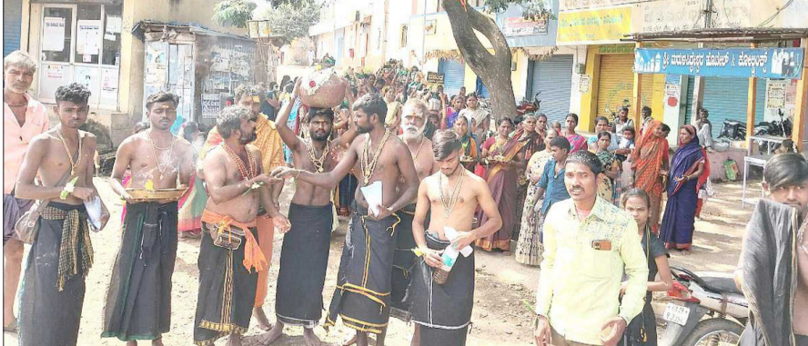
ಸಿಂಗರಿಸಿ, 18 ಮೆಟ್ಟಿಲುಗಳನ್ನು ನಿರ್ಮಿಸಿ, ಪಡಿ ಪೂಜೆ ನೆರವೇರಿಸಿದರು. ಅಯ್ಯಪ್ಪಸ್ವಾಮಿ