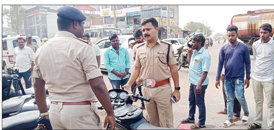
ಪ್ಲೇಟ್ ಇಲ್ಲಾ ನಿಲ್ಲೋ, ಏಯ್ ಈ ಬೈಕ್‌ಗೆ ನಂಬರ್ ಕೇಳಬುದ್ದಿವು. ಅವಳಿ ನಗರದಲ್ಲಿ ಟ್ರಾಫಿಕ್ ನಿಯಮಗಳ ಪ್ಲೇಟ್ ಇಲ್ಲ ಸೀಜ್ ಮಾಡಿ ಇತ್ಯಾದಿ ಮಾತುಗಳೂ ಉಲ್ಲಂಘನೆ ಪ್ರಕರಣಗಳ ನಿಯಂತ್ರಣಕ್ಕೆ ಪೊಲೀಸ್

■ ವಿಜಯಸಾಕ್ಷಿ ಸುದ್ದಿ, ಗದಗ ಅವಳಿ ನಗರದ ಪ್ರಮುಖ ವೃತ್ತಗಳಲ್ಲಿ ಶುಕ್ರವಾರ ಪೊಲೀಸ್ ಸಿಬ್ಬಂದಿಗಳ ಓಡಾಟ ತುಸು ಜೋರಾಗಿಯೇ ಇತ್ತು. ಪ್ರಮುಖ ಮಾರ್ಗಗಳಲ್ಲಿ ಸಂಚರಿಸುವ, ಸರ್ಕಲ್ ಬಳಸಿ ಹಾದುಹೋಗುವ ವಾಹನ ಸವಾರರು ಅರೆಸ್ಟ್ ದಿಗಿಲಿಗೊಳಗಾಗುತ್ತಿದ್ದರು. ನಡುವೆ 'ಏಯ್ ನಂಬರ್' ಸಿಪಿಎಂ, ಪಿಎಸ್‌ಐ ನೇತೃತ್ವದ 6 ತಂಡಗಳ ಮೂಲಕ ಸ್ಪೆಷಲ್ ಡ್ರೈವ್ ಮೂಲಕ 500ಕ್ಕೂ ಹೆಚ್ಚು ನಂಬರ್ ಪ್ಲೇಟ್ ಇಲ್ಲದ, ನಂಬರ್ ಪ್ಲೇಟ್‌ಗೆ ಸ್ವಿಚ್ ಆಂಟಿಸಿ ಮರಮಾಚಿದ ಬೈಕ್ ಸವಾರರಿಂದ ದಂಡ ವಸೂಲಿ ಮಾಡಿದ್ದಾರೆ. ಒಂದೊಂದು ಸ್ಥಳದಲ್ಲಿಯೂ ಸುಮಾರು 50ರಿಂದ 100 ಬೈಕ್‌ಗಳನ್ನು ಸೀಜ್ ಮಾಡಲಾಗಿದೆ.