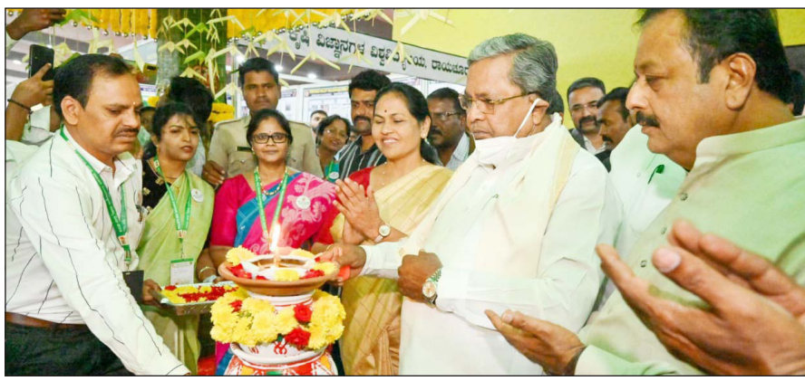
ರಫಿಗೆ ಅನುಕೂಲ ಆಗುವಂತೆ ಸಿರಿಧಾನ್ಯ ಬೆಳೆಗೆ ಪ್ರೋತ್ಸಾಹದಾಯಕವಾಗಿ ಅಗತ್ಯ ಕೇಂದ್ರವನ್ನು ರಾಜ್ಯ ಸರ್ಕಾರ ಸ್ಥಾಪಿಸಲಿದೆ ಎಂದು ಇದೇ ಸಂದರ್ಭದಲ್ಲಿ ಸಿವಿಂ ಭರವಸೆ ನೀಡಿದರು. ಕಡಿಮೆ ಮಳೆಯಾಗುವ ಪ್ರದೇಶ, ಭೂಮಿಯ ಫಲವತ್ತತೆ ಕಡಿಮೆ ಇರುವ ಪ್ರದೇಶಗಳಲ್ಲೂ

■ ವಿಜಯಸಾಕ್ಷಿ ಸುದ್ದಿ, ಬೆಂಗಳೂರು ನಮ್ಮ ರಾಜ್ಯದ ಜನರು ಮತ್ತು ಶಾಲಾ ಮಕ್ಕಳು ಇನ್ನಷ್ಟು ಸದೃಢ, ಆರೋಗ್ಯವಂತರಾಗಲು ಇಂದಿರಾ ಕ್ಯಾಂಟೀನ್ ಮತ್ತು ಶಾಲಾ ಊಟದಲ್ಲಿ ಸಿರಿಧಾನ್ಯ ಬಳಸುವ ಕುರಿತು ಸದ್ಯದಲ್ಲೇ ಸಂಬಂಧಪಟ್ಟ ಇಲಾಖೆಗಳ ಸಭೆ ಕರೆದು ಚರ್ಚಿಸಿ ತೀರ್ಮಾನಿಸಲಾಗುವುದು ಎಂದು ಮುಖ್ಯಮಂತ್ರಿ ಸಿದ್ದರಾಮಯ್ಯ ಮಹತ್ವದ ಘೋಷಣೆ ಮಾಡಿದರು. ಅರಮನೆ ಮೈದಾನದಲ್ಲಿ ಕೃಷಿ ಇಲಾಖೆ ಆಯೋಜಿಸಿದ್ದ ಸಿರಿಧಾನ್ಯ ಮತ್ತು ಸಾವಯವ ಅಂತರಾಷ್ಟ್ರೀಯ ವಾಣಿಜ್ಯ ಮೇಳ-2024, ಸಿರಿಧಾನ್ಯ ತಿನಿಸುಗಳ ಪ್ರದರ್ಶನ ಮತ್ತು ಮಾರಾಟ ಮಳಿಗೆಗಳನ್ನು ಉದ್ಘಾಟಿಸಿ ಅವರು ಮಾತನಾಡಿದರು. ಉತ್ತಮ ಗುಣಮಟ್ಟದ ಸಿರಿಧಾನ್ಯ ಬೀಜ ಉತ್ಪಾದನೆ, ಹೊಸ ತಳಿ ಅಭಿವೃದ್ಧಿ ಹಾಗೂ ಸಿರಿಧಾನ್ಯ