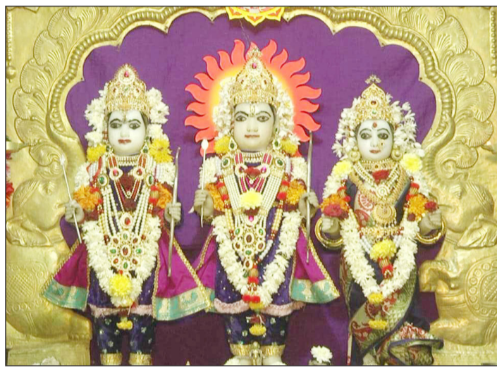
ಎಂದರೆ ಅಚ್ಚರಿಯಾದೀತು. ಮಾತೆ ಸೀತಾ ದೇವಿಯನ್ನರಸಿ ಹೊರಟ ಶ್ರೀರಾಮ

■ ವಿಜಯಸಾಕ್ಷಿ ಸುದ್ದಿ, ಗದಗ ಅಸಂಖ್ಯಾತ ಹಿಂದೂ ಬಾಂಧವರ ಆರಾಧ್ಯ ದೇವರು ಶ್ರೀರಾಮಚಂದ್ರ ಸುದೀರ್ಘ ಹೋರಾಟದ ತರುವಾಯ ಮರ್ಯಾದಾ ಪುರುಷೋತ್ತಮ ಶ್ರೀರಾಮನ ಭವ್ಯವಾದ ಮಂದಿರ ಅಯೋಧ್ಯೆಯಲ್ಲಿ ಸಿದ್ಧವಾಗಿದ್ದು, ಮಂದಿರದ ಉದ್ಘಾಟನೆಗೆ ದಿನಗಣನೆ ಆರಂಭವಾಗಿದೆ, ಸಮಸ್ತ ಭಕ್ತರು ಈ ಅವಿಸ್ಮರಣೀಯ, ಐತಿಹಾಸಿಕ ಕ್ಷೇತ್ರಕ್ಕೆ ಎದುರುನೋಡುತ್ತಿದ್ದಾರೆ. ಹೀಗಿರುವಾಗ, ಪ್ರಭು ಶ್ರೀರಾಮಚಂದ್ರ ಹಾಗೂ ಕರ್ನಾಟಕಕ್ಕೆ ಹಲವು ನಂಟುಗಳಿರುವುದು ಐತಿಹಾಸದಿಂದ ತಿಳಿದುಬರುತ್ತದೆ. ಅಂತೆಯೇ ಪ್ರಭು ಶ್ರೀರಾಮನಿಗೂ ಮುದ್ರಣ ಕಾಶಿ ಗದಗ ಜಿಲ್ಲೆಗೂ ಅವಿನಾಭಾವ ಸಂಬಂಧವಿದೆ ಎಂದರೆ ಅಚ್ಚರಿಯಾದೀತು. ಮಾತೆ ಸೀತಾ ದೇವಿಯನ್ನರಸಿ ಹೊರಟ ಶ್ರೀರಾಮ