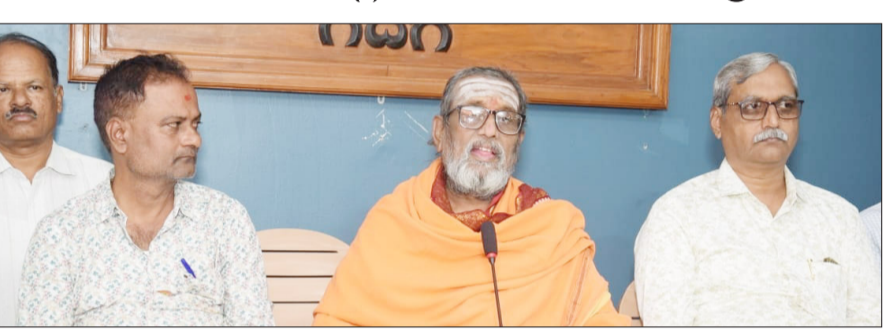
■ ವಿಜಯಸಾಕ್ಷಿ ಸುದ್ದಿ, ಗದಗ