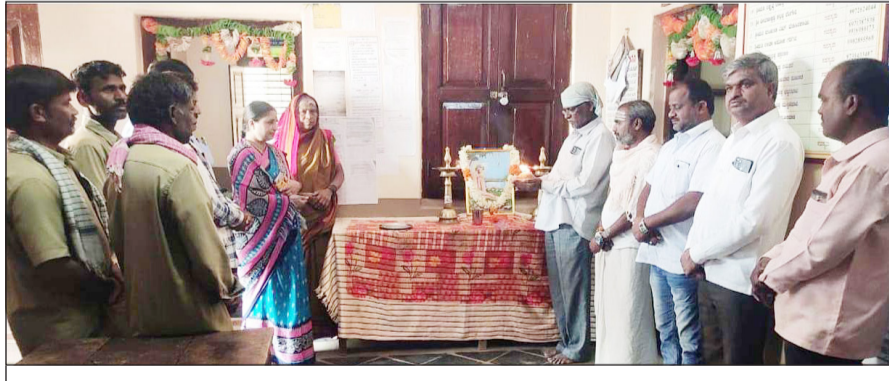
■ ವಿಜಯಸಾಕ್ಷಿ ಸುದ್ದಿ, ಲಕ್ಕಂದಿ