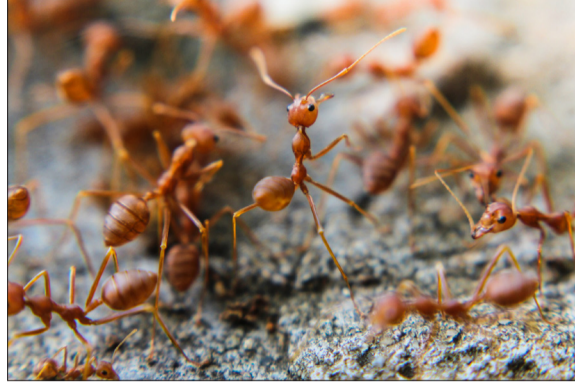
ಅಳವಡಿಸಿಕೊಂಡಿದ್ದಾರೆ. ಒಡಿಶಾದ ಮಯೂರಭಂಜ್ ಜಿಲ್ಲೆಯಲ್ಲಿ, ಈ ಕೆಂಪು ನೇಕಾರ ಇರುವೆಗಳನ್ನು 'ಕೈ ಚಟ್ಟಿ' ತಯಾರಿಸಲು ಬಳಸಲಾಗುತ್ತದೆ.

ಒಡಿಶಾದ ಪಾಕಶಾಲೆಯ ಸಂಪ್ರದಾಯಗಳಲ್ಲಿ ಬೇರೂರಿರುವ ಈ ಅಸಾಂಪ್ರದಾಯಿಕ, ಅಸಾಧಾರಣ ಪಾಕ ಪದ್ಧತಿ ಸಾಂಸ್ಕೃತಿಕ ಪರಂಪರೆಯ ಸಂಕೇತವಾಗಿದೆ. ಅದರ ವಿಶಿಷ್ಟ ಪರಿಮಳವನ್ನು ಮೀರಿ, ಜಿಬಿ ಟ್ಯಾಗ್ ಪಡೆದ ಕೆಂಪು ಇರುವೆ ಚಟ್ಟಿ ಅಸಾಧಾರಣ ಪೌಷ್ಟಿಕಾಂಶದ ಗುಣಗಳನ್ನು ಹೊಂದಿರುವ ಸೂಪರ್ ಫುಡ್ ಆಗಿ ಮಾನ್ಯತೆ ಗಳಿಸಿದೆ. ವೈಜ್ಞಾನಿಕವಾಗಿ ಒಕ್ಕೂಟಿಲ್ಲಾ ಸ್ಮರಗ್ನಿನಾ ಎಂದು ಕರೆಯಲ್ಪಡುವ ಕೆಂಪು ಇರುವೆ ಇರುವೆ, ಚಿಗ್ಗೆ ಇರುವೆ, ಕೆಂಪಿರುವೆ ಎಂದೆಲ್ಲಾ ಕರೆಯಿಸಿಕೊಳ್ಳುವ ಇರುವೆ ಪ್ರಬೇದ ತಮ್ಮ ನೋವಿನ ಕುಟುಕುವಿಕೆಗೆ ಹೆಸರುವಾಸಿಯಾಗಿದೆ. ಚರ್ಮದ ಮೇಲೆ ಗುಳ್ಳೆಗಳನ್ನು ಉಂಟುಮಾಡುವ ಸಾಮರ್ಥ್ಯವನ್ನು ಹೊಂದಿವೆ.