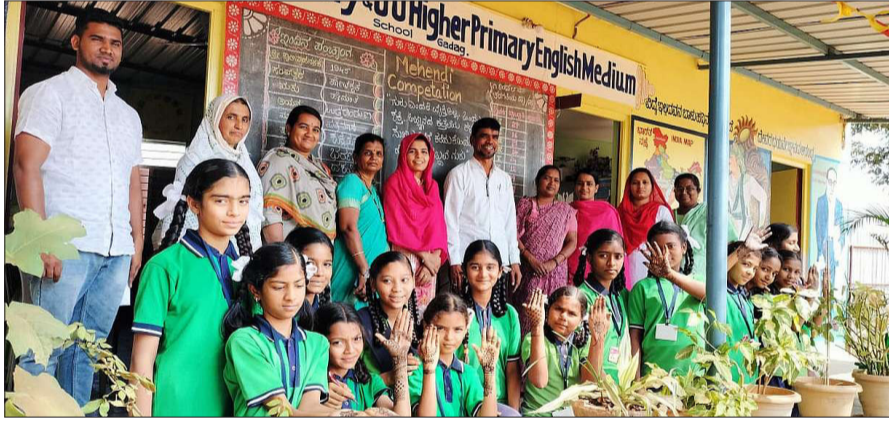
■ ವಿಜಯಸಾಕ್ಷಿ ಸುದ್ದಿ, ಗದಗ