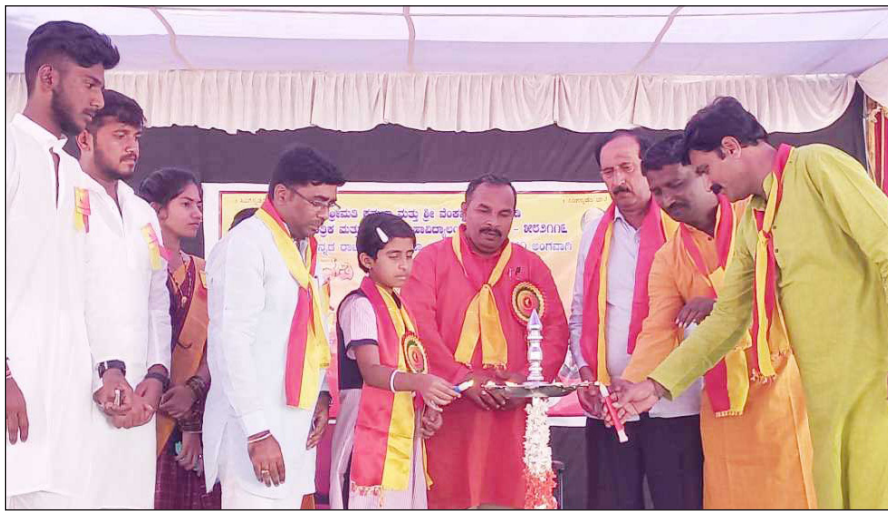
ಕಾಲೇಜಿನ ಕನ್ನಡ ಸಂಘ, ಎನ್‌ಎಸ್‌ಎಸ್ ಘಟಕದ ಸಹಯೋಗದಲ್ಲಿ ಕಾಲೇಜಿನ ಎಲ್ಲ ವಿಭಾಗದ ವತಿಯಿಂದ ಕೈಗೊಂಡ ಅಗಡಿ ಕನ್ನಡ ಹಬ್ಬ ವಿದ್ಯಾರ್ಥಿಗಳಲ್ಲಿ ಸಂಭ್ರಮ ಮೂಡಿಸಿತು. ಕಾಲೇಜಿನಲ್ಲೆಡೆ ಕನ್ನಡದ ಬಾವುಟಗಳು ರಾರಾಜಿಸಿ ಕನ್ನಡ ಕಂಪು ಮೇಳಿಸಿತ್ತು. ಕನ್ನಡ ಹಬ್ಬದ ನಿಮಿತ್ತ ಕಳೆದ ಒಂದು ವಾರದಿಂದ ವಿವಿಧ ವಿಭಾಗಗಳ ವಿದ್ಯಾರ್ಥಿಗಳಿಂದ ಕನ್ನಡ ಕುರಿತ ಪ್ರಬಂಧ, ಚರ್ಚಾ ಸ್ಪರ್ಧೆ, ನೃತ್ಯ, ಹಾಡು, ಸಂಗೀತ, ಚಿತ್ರಕಲಾ ಸ್ಪರ್ಧೆ ಏರ್ಪಡಿಸಲಾಗಿತ್ತು. ಗುರುವಾರ ನಡೆದ ಕನ್ನಡ ಹಬ್ಬ ಕಾರ್ಯಕ್ರಮದಲ್ಲಿ ವಿಜೇತ ವಿದ್ಯಾರ್ಥಿಗಳು ಪ್ರಶಸ್ತಿ ನೀಡಿ ಗೌರವಿಸಲಾಯಿತು.