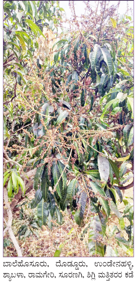
ತುತ್ತಾಗಿರುವುದು ಬೆಳೆಗಾರರನ್ನು ಹತಾಶಗೊಳಿಸಿದೆ. ತೋಟಗಾರಿಕಾ ಇಲಾಖೆಯ ಮಾಹಿತಿಯಂತೆ, ಲಕ್ಷ್ಮೇಶ್ವರ/ತಿರಹಟ್ಟಿ ತಾಲೂಕಿನ ಲಕ್ಷ್ಮೇಶ್ವರ, ಚಾಲ್ಕೋಸೂರು, ದೊಡ್ಡೂರು, ಉಂಡೇನಹಳ್ಳಿ, ಶ್ಯಾಬಾ, ರಾಮಗೆರಿ, ಸೂರಣಗಿ, ಶಿಗ್ಗಿ ಮತ್ತಿತರರ ಕಡೆ

ಬೆಳೆ ಹುಳು ವಿಸರ್ಜಿಸುವ ಸಿಹಿ ದ್ರವವು ಕೀಟಗಳನ್ನು ಆಕರ್ಷಿಸುತ್ತದೆ ಮತ್ತು ಇದು ಬೂದಿಯಂತಹ ಬೂಸ್ಟ್‌ನ ಬೆಳವಣಿಗೆಗೆ ಕಾರಣವಾಗಿ ಬೆಳೆ ನಷ್ಟವನ್ನುಂಟುಮಾಡುತ್ತದೆ. ರೈತರು ಆರಂಭದಲ್ಲಿ ಇದನ್ನು ಹತ್ತೊಟ್ಟಿಗೆ ತಂದುಕೊಂಡರೆ ಫಸಲು ಉಳಿಸಿಕೊಳ್ಳಲು ಸಾಧ್ಯ. ನಿಯಂತ್ರಣಕ್ಕಾಗಿ 10 ಲೀ. ನೀರಿಗೆ 3 ಎಂಎಲ್ ಇಮಿಡಾಕ್ಲೋಪ್ರಿಡ್, 10 ಗ್ರಾಂ ಕಾರ್ಬನ್ ಡೈಜಿಮ್, 30 ಎಂಎಲ್ ಬೇವಿನ ಎಣ್ಣೆ, ಅಂಟು ದ್ರಾವಣವನ್ನು ಬೆರೆಸಿ ವಾರಕ್ಕೊಮ್ಮೆ 2 ಬಾರಿ ಸಿಂಪಡಿಸಬೇಕು. ವಾರದ ನಂತರ 75 ಗ್ರಾಂ ಮ್ಯಾಂಗ್ನೀಸ್ ಸೆಪ್ಟೆಲ್ ದ್ರಾವಣವನ್ನು 15 ಲೀ. ನೀರಿಗೆ ಬೆರೆಸಿ ಸಿಂಪಡಿಸಬೇಕು. ವಾರದ ನಂತರ 25 ಎಂ.ಎಲ್ ಡೈಕ್ಯೋಪಾಲ್, 10 ಗ್ರಾಂ ಕಾರ್ಬನ್ ಡೈಜಿಂ, 20 ಎಂ.ಎಲ್ ಬೇವಿನ ಎಣ್ಣೆ 15 ಲೀ. ನೀರಿಗೆ ಸೇರಿಸಿ ಸಿಂಪಡಿಸಬೇಕು. ಅಗತ್ಯವಿದ್ದರೆ ಮಾವು ಸ್ಪೆಷಲ್ ದ್ರಾವಣ ಮರು ಸಿಂಪರಣೆ ಮಾಡಬಹುದು. ಅಲ್ಲದೇ ಮೋಹಕ ಬಲೆಗಳನ್ನು ಅಳವಡಿಸಬೇಕು. ಮಾಹಿತಿಗೆ-9480957203 ಸಂಪರ್ಕಿಸಬಹುದು. -ಸುರೇಶ್ ಕುಂಬಾರ, ಸಹಾಯಕ ನಿರ್ದೇಶಕರು, ತೋಟಗಾರಿಕೆ ಇಲಾಖೆ.