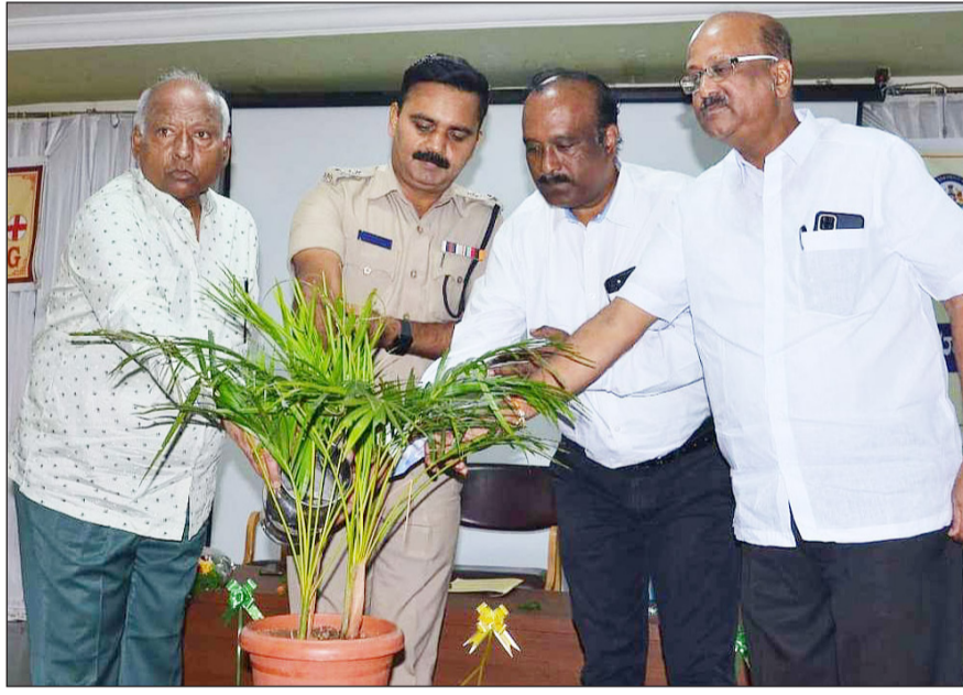
ತಂದೆ-ತಾಯಿಗಳು ನಿಮ್ಮ ಶ್ರೇಯೋಭಿವೃದ್ಧಿಗಾಗಿ ಅವರ ಕನಸನ್ನು ಭಗ್ನಗೊಳಿಸದೆ ಹಗಲಿರುಳು ಶ್ರಮಿಸುತ್ತಿದ್ದಾರೆ. ಜಾರಾಣಬೇಕೆಂದು ವಿದ್ಯಾರ್ಥಿಗಳಿಗೆ ಕರೆ ನೀಡಿದರು.