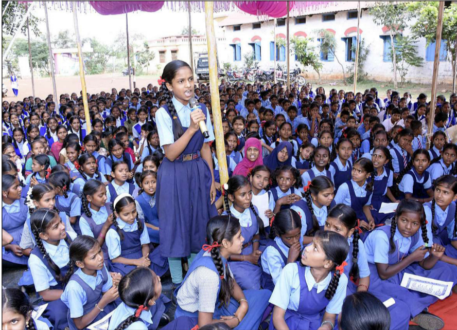
ಸಂಖ್ಯೆಗನುಗುಣವಾಗಿ ಈಗಿರುವ ಶೌಚಾಲಯ ಸಾಕಾಗುವುದಿಲ್ಲ, ಹೆಚ್ಚಿನ ಶೌಚಾಲಯ ನಿರ್ಮಿಸಬೇಕು.

■ ವಿಜಯಸಾಕ್ಷಿ ಸುದ್ದಿ, ಲಕ್ಕಂದಿ ಇಲ್ಲಿಯ ಬಾಲಕಿಯರ ಸರಕಾರಿ ಪ್ರೌಢಶಾಲೆಯಲ್ಲಿ ಗ್ರಾಮೀಣಾಭಿವೃದ್ಧಿ ಮತ್ತು ಪಂಚಾಯತ್ ರಾಜ್ ಇಲಾಖೆ, ತಾ.ಪಂ, ಜಿ.ಪಂ ಹಾಗೂ ಗ್ರಾಮ ಪಂಚಾಯತಿಗಳ ಸಹಯೋಗದಲ್ಲಿ ನಡೆದ 'ಮಕ್ಕಳ ಹಕ್ಕುಗಳ ಗ್ರಾಮಸಭೆ'ಯಲ್ಲಿ ಶುದ್ಧ ಕುಡಿಯುವ ನೀರು, ಶಾಲೆಗೆ ಬರುವ ಮಾರ್ಗದಲ್ಲಿ ಪುರುಷರ ಬಯಲು ಬಹಿಷ್ಕರಣೆ, ಶೌಚಾಲಯ ನಿರ್ಮಾಣ ಸೇರಿದಂತೆ ಹಲವು ಮೂಲಭೂತ ಸೌಲಭ್ಯಗಳನ್ನು ಒದಗಿಸಿಕೊಡಬೇಕೆಂದು ವಿದ್ಯಾರ್ಥಿಗಳು ಒತ್ತಾಯಿಸಿದರು. ಹಲವಾರು ವರ್ಷಗಳಿಂದ ನಲ್ಲಿಯ ನೀರನ್ನೇ ಕುಡಿಯುತ್ತಿದ್ದು, ಶುದ್ಧ ಕುಡಿಯುವ ನೀರನ್ನು ಒದಗಿಸಬೇಕೆಂದು ವಿವಿಧ ಶಾಲೆಯ ಮಕ್ಕಳು ಒತ್ತಾಯಿಸಿದರು. ನಾವು ಶಾಲೆಗೆ ಬರುವ ರಸ್ತೆಯಲ್ಲಿ ಪುರುಷರು ಬಯಲಿನಲ್ಲಿ ಮಲ ವಿಸರ್ಜನೆಗೆ ಕುಳಿತಿರುತ್ತಾರೆ. ಇದರಿಂದ ರಸ್ತೆಯಲ್ಲಿ ಬರುವುದಕ್ಕೆ ಅವಮಾನವಾಗುತ್ತಿದೆ. ಈ ವ್ಯವಸ್ಥೆಯನ್ನು ತಪ್ಪಿಸಿ ಉತ್ತಮ ಪರಿಸರ ನಿರ್ಮಾಣ ಮಾಡಬೇಕೆಂದು ಬಾಲಕಿಯರ ಸರಕಾರಿ ಪ್ರೌಢಶಾಲೆ ವಿದ್ಯಾರ್ಥಿಗಳು ಅಳಲು ತೋಡಿಕೊಂಡರು. ವಿದ್ಯಾರ್ಥಿಗಳ