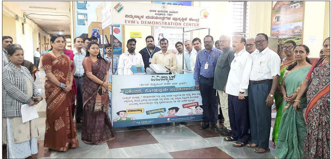
ಜಿಲ್ಲಾಡಳಿತ ಭವನದಲ್ಲಿ ಚಾಲನೆ ನೀಡಿ ವಿದ್ಯುನ್ಮಾನ ಮತಯಂತ್ರದಲ್ಲಿ ಮತದಾನ ಮಾಡಿದ ನಂತರ ಅರ್ಹ ಮತದಾರರು ಚಲಾಯಿಸುವ ಮತವು ಚಲಾಯಿಸಿದ ಪಕ್ಷ ಅಥವಾ ವ್ಯಕ್ತಿಗೆ ದಾಖಲಾದ ಬಗ್ಗೆ