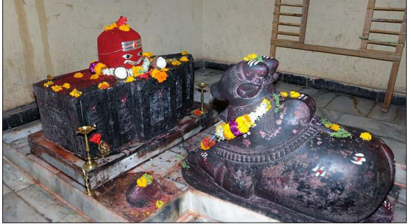
ನರವೇರಿಸಲಾಗುವುದು. ಸಕಲ ಮಂಡಳಿಯ ರಾಜು ಬುರಡಿ ಭಕ್ತರು ಪಾಲ್ಗೊಳ್ಳಬೇಕೆಂದು ಭಕ್ತ ತಿಳಿಸಿದ್ದಾರೆ.

■ ವಿಜಯಸಾಕ್ಷಿ ಸುದ್ದಿ, ಲಕ್ಷ್ಮೀಶ್ವರ ಪಟ್ಟಣದ ಕೆಂಚಲಾಪುರ ಓಣಿಯ ಕೊಟ್ಟೂರ ಬಸವೇಶ್ವರ ದೇವಸ್ಥಾನದಲ್ಲಿ ಕಾರ್ತಿಕ ಮಾಸದ ನಿಮಿತ್ತ ಡಿ.18ರಂದು ಸಂಜೆ 6ಕ್ಕೆ ಕೊಟ್ಟೂರ ದೀಪೋತ್ಸವ ಹಮ್ಮಿಕೊಳ್ಳಲಾಗಿದೆ. ಕಾರ್ತಿಕೋತ್ಸವದ ಅಂಗವಾಗಿ ದೇವಸ್ಥಾನದಲ್ಲಿ ಬಳ್ಳಾರಿಯ ಕೊಟ್ಟೂರಿನಲ್ಲಿ ನಡೆಯುವಂತೆ ವಿಶೇಷ ಪೂಜೆ, ದೀಪೋತ್ಸವ ಕಾರ್ಯಕ್ರಮಗಳನ್ನು ವಿಜೃಂಭಣೆ ಮತ್ತು ಶ್ರದ್ಧಾ-ಭಕ್ತಿಯಿಂದ