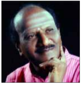
ಡಾ. ಪಂ.ಪುಟ್ಟರಾಜ ಕವಿ ಗವಾಯಿಗಳವರ ಶಿಷ್ಯರಾದ