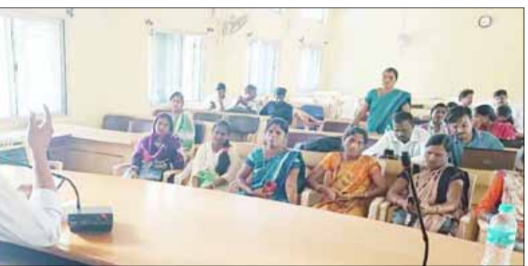
ಪ್ರಮಾಣದಲ್ಲಿ 50% ರಿಯಾಯಿತಿ ಇದೆ. ಇದನ್ನು IEC ಚಟುವಟಿಕೆ ಮೂಲಕ ತಿಳಿಸಲಾಗಿದೆ. ಆದರೂ ಗ್ರಾಮೀಣ ಭಾಗದಲ್ಲಿ ನಿಮ್ಮ ಮಾತು ಜನರು ಕೇಳುತ್ತಾರೆ ಈ ಒನ್ನಲೆ ತಾವು ವಿಷಯವನ್ನು ಮುಟ್ಟಿಸಿ ಎಂದರು. ಈ ವರ್ಷದ ಕ್ರಿಯಾ ಯೋಜನೆಯಲ್ಲಿ ಒಂದು ಲಕ್ಷಕ್ಕೂ ಅಧಿಕ ಗಿಡಗಳನ್ನು ನೆಡುವುದು ನಮ್ಮ ರೋಣ ತಾಲೂಕು ಪಂಚಾಯತ ಗುರಿ. ನಿಸರ್ಗ ದಿಂದ ನಾವು ತೆಗೆದುಕೊಳ್ಳುವುದು ಮಾತ್ರ ಮಾಡುತ್ತಿದ್ದೇವೆ ಮರಳಿ ಕೊಡುತ್ತಿಲ್ಲ ಈ ನಿಟ್ಟಿನಲ್ಲಿ ಗಿಡಗಳನ್ನು ನೆಟ್ಟು ನಾವು ಹಸಿರುಕರಣಕ್ಕೆ ಶ್ರಮಿಸೋಣ ಎಂದರು. ಈ ಮೊದಲು ಗಿಡಗಳನ್ನು ನೆಟ್ಟು ಪಾಲನೆ-ಪೋಷಣೆ ಮಾಡಿದ ಗ್ರಾಮ ಪಂಚಾಯತಿಗೆ ಹಾಗೂ ಸಿಬ್ಬಂದಿಗಳನ್ನು ಗುರುತಿಸಿ ಅವರಿಗೆ ಸನ್ಮಾನ