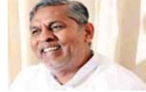
ಕುಷ್ಟಗಿ ತಾಲೂಕಿನ ಎಂ. ಗುಡದೂರು ಗ್ರಾಮದಲ್ಲಿ ಮಹಿಳೆಯ ಮೇಲೆ ಕಾಂಗ್ರೆಸ್ ಮುಖಂಡ ಅತ್ಯಾಚಾರ ಆರೋಪ ಕೇಳಿ ಬಂದಿದ್ದು ಕೇಸ್ ದಾಖಲಾದ್ದೂ ಕುಕ್ಕೆ ಸಬಂಧ ಇಷ್ಟುಂದ ಮಿನೂವೇಷ ಮಾಡುತ್ತಿದ್ದಾರೆ ಎನ್ನಲಾಗಿದೆ. ಹೀಗಾಗಿ ಸಂಸ್ಥೆ ಮಹಿಳೆಯ ಮಾವ ನ್ಯಾಯಕ್ಕೆ ಎಸ್ಸಿ, ಮಾಜಿ ಶಾಸಕರಿಗೆ ಮನವಿ ಮಾಡಿದ್ದಾಗ ಈ ವೇಳೆ ಮಾಜಿ ಶಾಸಕ ಈ ರೀತಿ ಹೇಳಿರುವ ಆಡಿಯೋ ವೈರಲ್ ಆಗಿದೆ.