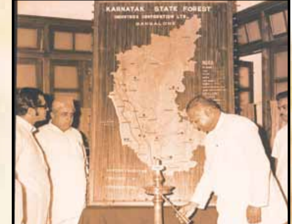
ಮೈಸೂರು ರಾಜ್ಯಕ್ಕೆ ಕರ್ನಾಟಕವೆಂದು ನಾಮಕರಣವಾದ ನಿಮಿತ್ತ 3ನೇ ನವೆಂಬರ್ 1973 ರಂದು ಗದುಗಿನ ದಿ ಕಾಟನ್ ಸೇಲ್ ಸೊಸೈಟಿಯಲ್ಲಿ ಕರ್ನಾಟಕ ಸಚಿವರಾದ ಶ್ರೀ ಕೆ. ಎಚ್. ಪಾಟೀಲರವರು ಮಾತನಾಡುತ್ತಿರುವುದು.