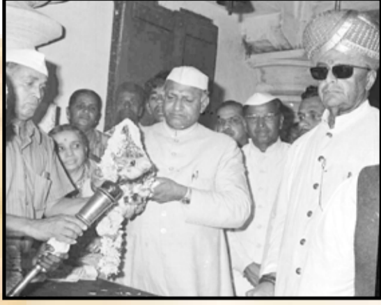
ಮೈಸೂರು ರಾಜ್ಯಕ್ಕೆ ಕರ್ನಾಟಕವೆಂದು ನಾಮಕರಣವಾದ ನಿಮಿತ್ತ 3ನೇ ನವೆಂಬರ್ 1973 ರಂದು ಗದುಗಿನ ದಿ ಕಾಟನ್ ಸೇಲ್ ಸೊಸೈಟಿಯಲ್ಲಿ ನಡೆದ ಸಾರ್ವಜನಿಕ ಸಭೆಯಲ್ಲಿ ಮುಖ್ಯಮಂತ್ರಿಗಳಾದ ಶ್ರೀ ಡಿ. ದೇವರಾಜ್ ಅರಸ್, ಕೃಷಿ ಮತ್ತು ಅರಣ್ಯ ಸಚಿವರಾದ ಶ್ರೀ ಕೆ. ಎಚ್. ಪಾಟೀಲರವರು ಮಾತನಾಡುತ್ತಿರುವುದು.