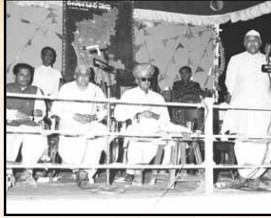
3ನೇ ನವೆಂಬರ್ 1973 ರಂದು ಗದುಗಿನ ದಿ ಕಾಟನ್ ಸೇಲ್ ಸೊಸೈಟಿಯಲ್ಲಿ ನಡೆದ ಸಾರ್ವಜನಿಕ ಸಭೆಯಲ್ಲಿ ಮುಖ್ಯಮಂತ್ರಿಗಳಾದ ಶ್ರೀ ಡಿ. ದೇವರಾಜ್ ಅರಸ್, ಕೃಷಿ ಮತ್ತು ಅರಣ್ಯ ಸಚಿವರಾದ ಶ್ರೀ ಕೆ. ಎಚ್. ಪಾಟೀಲರವರು ಮಾತನಾಡುತ್ತಿರುವುದು.