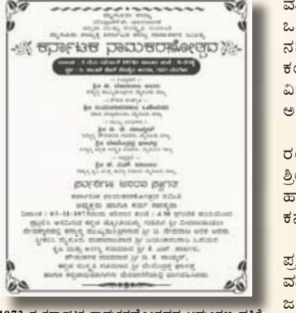
1973 ರ ಕರ್ನಾಟಕ ನಾಮಕರಣೋತ್ಸವದ ಅಮಂತ್ರಣ ಪತ್ರ