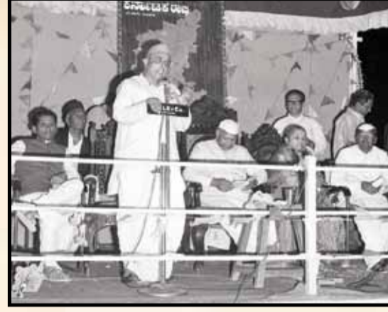
3ನೇ ನವೆಂಬರ್ 1973 ರಂದು ಗದುಗಿನ ದಿ ಕಾಟನ್ ಸೇಲ್ ಸೊಸೈಟಿಯಲ್ಲಿ ನಡೆದ ಸಾರ್ವಜನಿಕ ಸಭೆಯಲ್ಲಿ ಕೃಷಿ ಮತ್ತು ಅರಣ್ಯ ಸಚಿವರಾದ ಶ್ರೀ ಕೆ. ಎಚ್. ಪಾಟೀಲರವರು ಮಾತನಾಡುತ್ತಿರುವುದು.