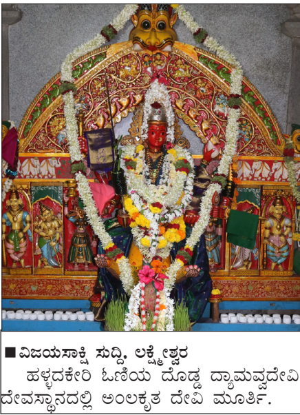
■ ವಿಜಯಸಾಕ್ಷಿ ಸುದ್ದಿ, ಲಕ್ಕೇಶ್ವರ ಹಳ್ಳದಕೇರಿ ಓಣಿಯ ದೊಡ್ಡ ದ್ರಾಮವ್ಯವೇವಿ ದೇವಸ್ಥಾನದಲ್ಲಿ ಅಂಲಕೃತ ದೇವಿ ಮೂರ್ತಿ.