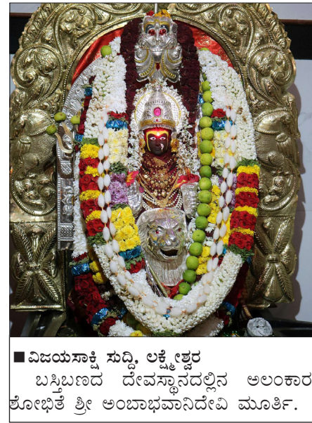
■ ವಿಜಯಸಾಕ್ಷಿ ಸುದ್ದಿ, ಲಕ್ಕೇಶ್ವರ ಬಸ್ತಿಯಾದ ದೇವಸ್ಥಾನದಲ್ಲಿನ ಅಲಂಕಾರ ಶೋಭಿತ ಶ್ರೀ ಅಂಬಾಭವಾನಿದೇವಿ ಮೂರ್ತಿ.