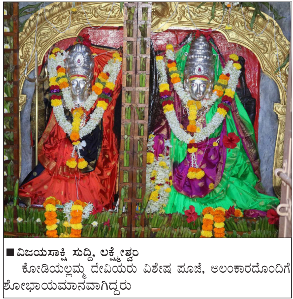
■ ವಿಜಯಸಾಕ್ಷಿ ಸುದ್ದಿ, ಲಕ್ಕೇಶ್ವರ ಕೋಡಿಯಲ್ಲಮ್ಮ ದೇವಿಯ ವಿಶೇಷ ಪೂಜೆ, ಅಲಂಕಾರದೊಂದಿಗೆ ಶೋಭಾಯವನವಾಗಿದ್ದರು

■ ವಿಜಯಸಾಕ್ಷಿ ಸುದ್ದಿ, ಲಕ್ಕೇಶ್ವರ ಪಟ್ಟಣದ ಎಂಜಿಎಂ ಫೌಂಡೇಶನ್ ವತಿಯಿಂದ ಕನ್ನಡ ರಾಜ್ಯೋತ್ಸವದ ಅಂಗವಾಗಿ ಪಟ್ಟಣ ಹಾಗೂ ಸುತ್ತಲಿನ ಗ್ರಾಮಗಳ 16 ವರ್ಷ ಮೇಲ್ಪಟ್ಟ ವಿದ್ಯಾರ್ಥಿಗಳು, ಯುವಕ-ಯುವತಿಯರಿಗೆ ಕನ್ನಡದಲ್ಲಿ ಉಚಿತ ಕಂಪ್ಯೂಟರ್ ತರಬೇತಿ ಹಮ್ಮಿಕೊಂಡಿದೆ. ಅ.30ರೊಳಗೆ ಪಟ್ಟಣದ ಮುಖ್ಯ ಬಜಾರ್ ರಸ್ತೆಯಲ್ಲಿ ಎಂಜಿಎಂ ಮಾರ್ಚ್ ಮತ್ತು ಗೋಲ್ಡನ್‌ಲೇಕ್ ರಸ್ತೆಯಲ್ಲಿ ಎಂಜಿಎಂ ಮಾರ್ಚ್ ಮತ್ತು ಗೋಲ್ಡನ್‌ಲೇಕ್ ರಸ್ತೆಯಲ್ಲಿನ ವಿಶ್ವ ಕಂಪ್ಯೂಟರ್‌ನಲ್ಲಿ ಅರ್ಜಿ ಸಲ್ಲಿಸಬೇಕು ಎಂದು ಪ್ರಕಟಣೆ ತಿಳಿಸಿದೆ.