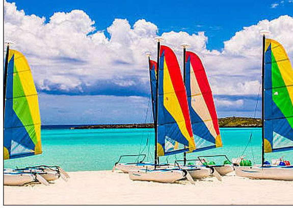
ಜಿಲ್ಲಾಡಳಿತ, ಪ್ರವಾಸೋದ್ಯಮ ಇಲಾಖೆ, ಯುವ ಸಬಲೀಕರಣ ಮತ್ತು ಕ್ರೀಡಾ ಇಲಾಖೆ, ಗದಗ ಸ್ಪೋರ್ಟ್ಸ್ ಅಸೋಸಿಯೇಶನ್ ಸೇರಿದಂತೆ ಇತರ ಇಲಾಖೆಗಳ ಸಂಯುಕ್ತ ಆಶ್ರಯದಲ್ಲಿ ಹಾಯಿ ದೋಣಿ ಜಲಕ್ರೀಡಾ ತರಬೇತಿ ಶಿಬಿರವನ್ನು ಜಿಲ್ಲೆಯ ಉತ್ಸಾಹಿಯವ ಜನತೆಗೆ ಏರ್ಪಡಿಸಲಾಗಿದೆ. ತರಬೇತಿಯು ಐದು ದಿನಗಳ ಅವಧಿಯಲ್ಲಿದ್ದು, ಮೊದಲನೇ ಬ್ಯಾಚ್ ಬೆಳಿಗ್ಗೆ 9.30ರಿಂದ

■ ವಿಜಯಸಾಕ್ಷಿ ಸುದ್ದಿ, ಗದಗ ಯುವಕ-ಯುವತಿಯರಲ್ಲಿ ಕ್ರೀಡಾ ಅಭಿರುಚಿಯನ್ನು ಅಭಿವೃದ್ಧಿ ಪಡಿಸಲು ಅ.21ರಿಂದ ನವೆಂಬರ್ 5ರವರೆಗೆ ಭೀಷ್ಮ ಕರೆಯಲ್ಲಿ 'ಹಾಯಿ ದೋಣಿ ಜಲ ಕ್ರೀಡಾ ತರಬೇತಿ ಶಿಬಿರ'ವನ್ನು ಆಯೋಜಿಸಲಾಗಿದೆ.