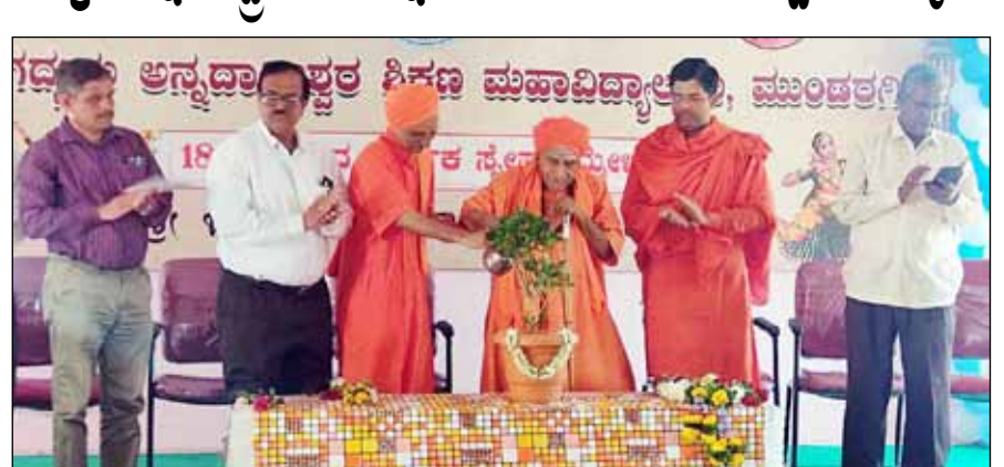
■ ವಿಜಯಸಾಕ್ಷಿ ಸುದ್ದಿ, ಮುಂಡಗಿ ಶಿಕ್ಷಣ ಮಹಾವಿದ್ಯಾಲಯದ ಪ್ರತಿಕ್ಷಣಾರ್ಥಿಗಳು ಭಾವಿ ಶಿಕ್ಷಕರು.

ಜಿ.ಅ.ವಿ.ಸಮಿತಿಯ ಜಿ.ಅ.ಶಿಕ್ಷಣ ವು ಹಾವಿ ದ್ಯಾಲಯದಲ್ಲಿ ಹಮ್ಮಿಕೊಂಡಿರುವ 18ನೇ ವಾರ್ಷಿಕ ಸ್ನೇಹ ಸಮ್ಮೇಳನ ಮತ್ತು ದ್ವಿತೀಯ ವರ್ಷದ ಪ್ರತಿಕ್ಷಣಾರ್ಥಿಗಳ