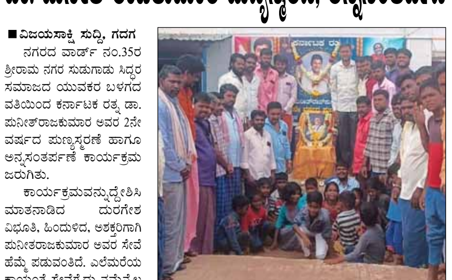
■ ವಿಜಯಸಾಕ್ಷಿ ಸುದ್ದಿ, ಗದಗ ನಗರದ ವಾರ್ಡ್ ನಂ.35ರ ಶ್ರೀರಾಮ ನಗರ ಸುಹೂಡು ಸಿದ್ಧರ ಸಮಾಜದ ಯುವಕರ ಬಳಗದ