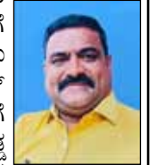
- ಎಂ.ಎಚ್ ಸವದತ್ತಿ ಸರ್ಕಾರಿ ಪ್ರೌಢಶಾಲೆ-ಏಕಲಾಸಪುರ.

ಪಟೇಲರ ಈ ಭವ್ಯ ಪುತ್ರಳೆಯನ್ನು ಅನಾವರಣಗೊಳಿಸಿದರು. 30 ಲಕ್ಷಕ್ಕಿಂತ ಅಧಿಕ ಪ್ರವಾಸಿಗರು ಇಲ್ಲಿ ಭೇಟಿ ನೀಡಿದ್ದು,