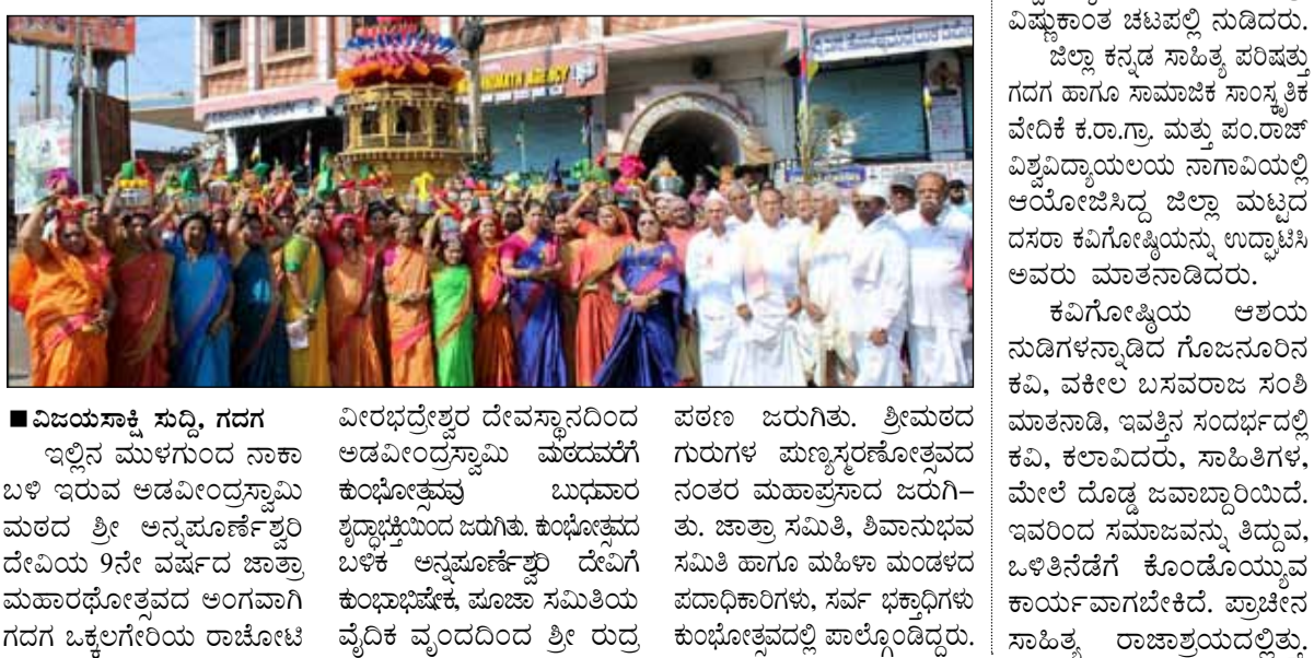
ವಿಜಯಸಾಕ್ಷಿ ಸುದ್ದಿ, ಗದಗ ವಿರಭದ್ರೇಶ್ವರ ದೇವಸ್ಥಾನದಿಂದ ಅಡಮೀನುತ್ತಾ ಮಹದೇವರಿಗೆ ಕುಂಭೋತ್ಸವವು ಬುಧವಾರ ಶೃಂಗಬೆಟ್ಟಿಯಿಂದ ಜರುಗಿತು. ಕುಂಭೋತ್ಸವ ಬಳಿಕ ಅನ್ಯಪೂರ್ಣಶ್ವರಿ ದೇವಿಗೆ ಕುಂಭಾಭಿಷೇಕ, ಮಂಜಾ ಸಮಿತಿಯ ವೈದಿಕ ವೃಂದದಿಂದ ಶ್ರೀ ರುದ್ರ ಪಠಣ ಜರುಗಿತು. ಶ್ರೀಮಠದ ಗುರುಗಳ ಪೂಜ್ಯತೀರ್ಥೋತ್ಸವದ ನಂತರ ಮಹಾಪ್ರಸಾದ ಜರುಗಿತು. ಜಾತ್ರಾ ಸಮಿತಿ, ಶಿವಾನುಭವ ಸಮಿತಿ ಹಾಗೂ ಮಹಿಳಾ ಮಂಡಳಿ ಪದಾಧಿಕಾರಿಗಳು, ಸರ್ವ ಭಕ್ತಾದಿಗಳು ಕುಂಭೋತ್ಸವದಲ್ಲಿ ಪಾಲ್ಗೊಂಡಿದ್ದರು.