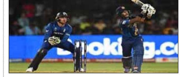
ಐಸಿಸಿ ಏಕದಿನ ವಿಶ್ವಕಪ್ ಟೂರ್ನಿಯಲ್ಲಿ ಹಾಲಿ ಚಾಂಪಿಯನ್ ಇಂಗ್ಲೆಂಡ್ ತಂಡಕ್ಕೆ ಮತ್ತೆ ಮುಖಭಂಗವಾಗಿದ್ದು, ನೆರೆಯ ಶ್ರೀಲಂಕಾ ವಿರುದ್ಧ 8 ವಿಕೆಟ್ ಗಳ ಹೀನಾಯ ಸೋಲು ಕಂಡಿದೆ.