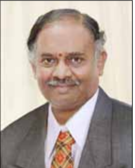
ಶಿಕ್ಷಕರ ಸಂಘ ಪ್ರಕಟಣೆಯಲ್ಲಿ ತಿಳಿಸಿದ, ಸಂಘಟಕರ ಅಮಂತ್ರಣದ