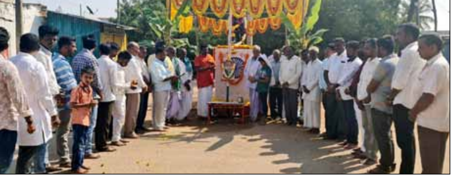
ಅಂಬಯ್ಯಸ್ವಾಮಿ ಮಠದಲ್ಲಿ ದೀಪಾವಳಿ, ಸನ್ಮಾನ ಕಾರ್ಯಕ್ರಮ