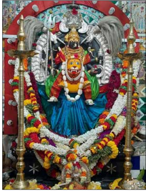
ಬೆಂಗಳೂರಿನಲ್ಲಿ ಎಸ್.ಎಸ್.ಎಸ್ ಸಮಾಜದ ಪಂಚ ಟ್ರಸ್ಟ್ ಕಮಿಟಿ, ಎಸ್.ಎಸ್.ಎಸ್ ಸಮಾಜದ ತರುಣ ಸಂಘ, ಎಸ್.ಎಸ್.ಎಸ್ ಸಮಾಜದ ಮಹಿಳಾ ಮಂಡಳದ ಸಂಯುಕ್ತಾಶ್ರಯದಲ್ಲಿ ಎಸ್.ಎಸ್.ಎಸ್ ಸಮಾಜದ ಆರಾಧ್ಯ ಜಗದಂಬಾ ದೇವಿಗೆ ವಿಜಯ ದಶಮಿ ನಿಮಿತ್ತ ವಿಷೇಶ ಅಲಂಕಾರ ನೆರವೇರಿಸಲಾಗುತ್ತದೆ.