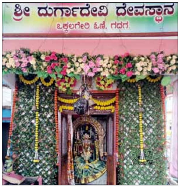
ಶ್ರೀ ದುರ್ಗಾದೇವಿ ದೇವಸ್ಥಾನ ಒಕ್ಕಲಗೇರಿ ಓ.ಪಿ. ಗದಗ