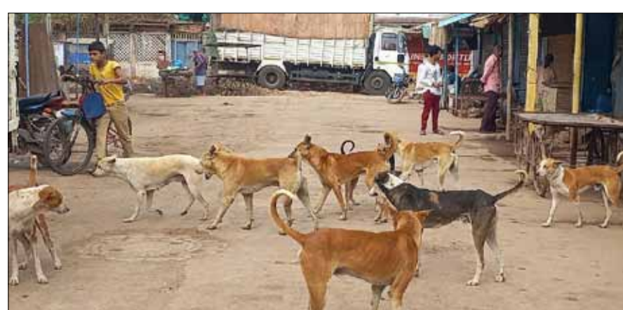
ನಾಯಿಗಳಿಂದ ಪಾರಾಗಲು ಸವಾರರು ಅಪಘಾತಕ್ಕೀಡಾಗುತ್ತಿದ್ದಾರೆ.

ವಿಜಯಸಾಕ್ಷಿ ಸುದ್ದಿ, ಲಕ್ಷ್ಮೇಶ್ವರ ಪಟ್ಟಣ ಸೇರಿದಂತೆ ತಾಲೂಕಿನಾದ್ಯಂತ ಹೆಚ್ಚುತ್ತಿರುವ ಬೀದಿ ನಾಯಿಗಳ ಹಾವಳಿಯಿಂದ ಜನತೆ ಬೆಚ್ಚಿ ಬೀಳುವಂತಾಗಿದ್ದು, ಮಕ್ಕಳನ್ನಷ್ಟೇ ಹೊರಬಿಡದ ಪರಿಸ್ಥಿತಿ ನಿರ್ಮಾಣವಾಗಿದೆ.