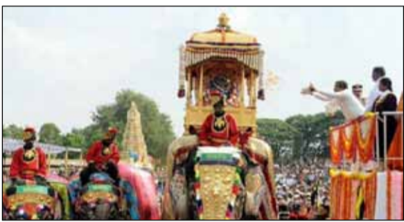
ನಾಡಹಬ್ಬ ನವರಾತ್ರಿ ಸಡಗರದ ನಡೆದಿರಲು ಮೈಸೂರು ಒಂದು ಸುತ್ತಿ ಬರೋಣ...