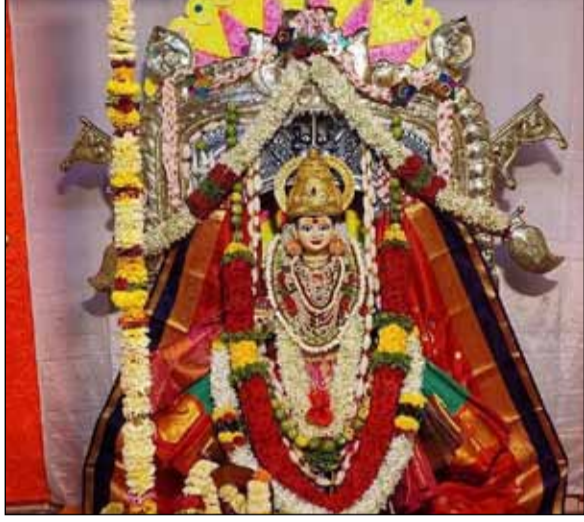
ಮುಂಡರಗಿ ಪಟ್ಟಣದ ಅಂಭಾವಾನಿ ದೇವಸ್ಥಾನದಲ್ಲಿ ನವರಾತ್ರಿ ಅಂಗವಾಗಿ ಮೊದಲ ದಿನದ ಘಟಿಸ್ತಾಪನ ಕಾರ್ಯಕ್ರಮ ನೆರವೇರಿಸಲಾಯಿತು. ಬೆಳಿಗ್ಗೆ ದೇವಿಗ ಬಂಗಾರ ಕಿರೀಟ ಧಾರಣೆ, ವಿಶೇಷ ಅಲಂಕಾರ ವಿವಿಧ ಪೂಜಾ ಕೈಕಾರ್ಯಗಳು ಜರುಗಿದವು.