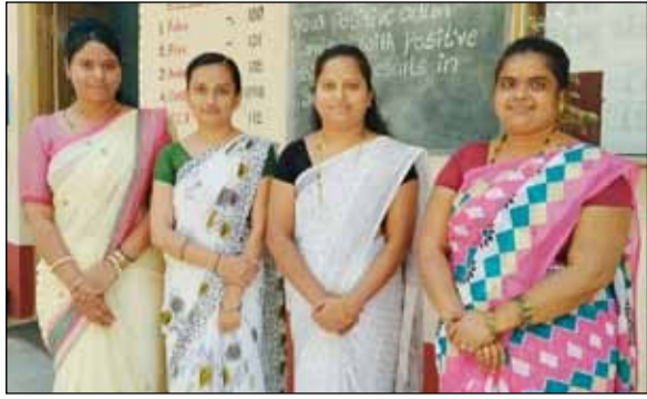
ಗದಗ ನಗರದ ವಿಡಿಎಸ್ ಕ್ಲಾಸಿಕ್ ಪ್ರಾಥಮಿಕ ಶಾಲೆಯ ಗುರುಮಾತೆಯರು ನವರಾತ್ರಿ ಸಂಭ್ರಮಾಚರಣೆಯ ಎರಡನೇ ದಿನ ಸಾಂಪ್ರದಾಯಿಕ ಉಡುಗೆಗಳನ್ನು ತೊಟ್ಟು ಸಂಭ್ರಮಿಸಿದರು.