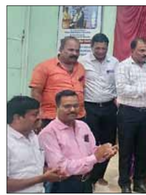
ಉತ್ತಮೀಕರಣ' ಕಾರ್ಯಾಗಾರ ಉದ್ಘಾಟಿಸಿ ಮಾತನಾಡಿದರು. ಶಿಕ್ಷಣ ಕ್ಷೇತ್ರ ಸರ್ವಕ್ಷೇತ್ರದ ಪ್ರಗತಿಯ ಮೂಲವಾಗಿದೆ. ಈ ಕ್ಷೇತ್ರದ ಅಮೂಲ್ಯ ಬದಲಾವಣೆ, ಸುಧಾರಣೆ, ಪ್ರಗತಿಯಲ್ಲಿ ಶಿಕ್ಷಣಾಧಿಕಾರಿಗಳ ಪಾತ್ರ ಹುಟ್ಟುತ್ತಿದ್ದು, ಮಕ್ಕಳಿಗೆ ಶಾಲಾ ಹಂತದಲ್ಲಿಯೇ ಬದುಕಿಗೆ ಸೂರಕವಾದ ಗಾಂಧೀಜಿ ಅವರ ಮೂಲ ಶಿಕ್ಷಣದ ಪರಿಕಲ್ಪನೆ ಅಡಕವಾಗಿರಬೇಕು ಎಂದರು. ಸಭೆಯ ನೇತೃತ್ವ ವಹಿಸಿದ್ದ